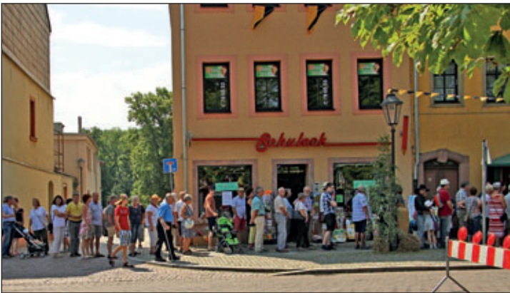
Großer Andrang am Einlass – am Sonntag wurde die Besetzung der Kassenhäuschen teilweise verdoppelt.