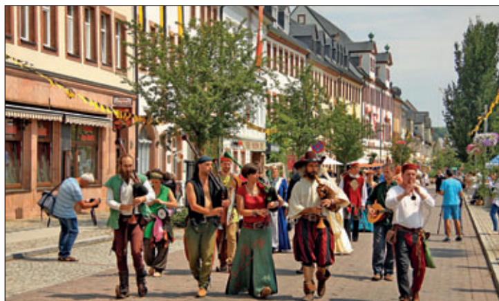
Musikanten ziehen durch die Rochlitzer Innenstadt

Natürlich haben wir dazugelernt. Vor 8 Jahren, zum ersten Fürstentag wurden Kunststoffmülltonnen zur Abfallentsorgung aufgestellt. Davon sind wir heute weit entfernt. Gemeinsam hat unser Rathausteam viel Mühe in die Stadtbildgestaltung investiert. Alte Wagenräder, Holzkisten, Strohhallen, 120 Birken und Grünpflanzen, Milchkannen, Pferdewagen, Tiergatter, Weinfässer, Holzpaletten und 250 Meter Jute-Stoff sind platziert und verbaut worden. Vieles davon haben Bürger, Einrichtungen und Unternehmen kostenfrei zur Verfügung gestellt. Dafür sage ich an dieser Stelle herzlich Danke.