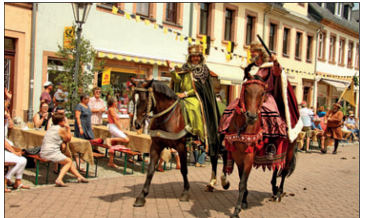
Die Wettiner geben sich die Ehre