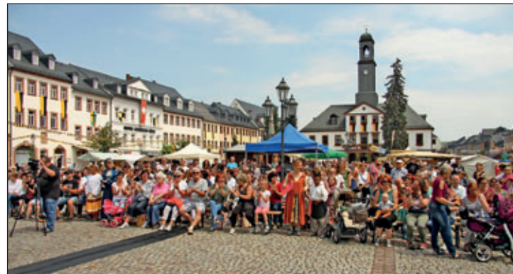
Mehrere Hundert Zuschauer verfolgen mit reichlich Applaus die amüsanten Bühnenprogramme