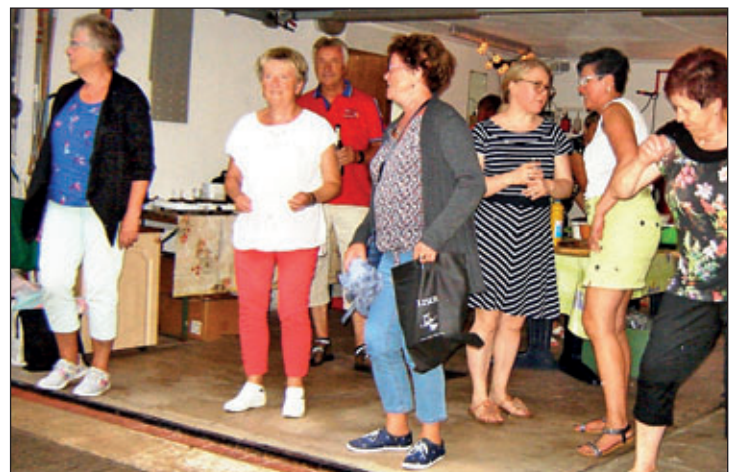
Eine spontane Tanzeinlage unter dem Garagendach