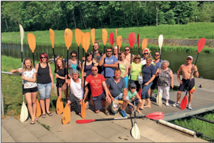
Gruppenfoto beim Umsetzen der Boote