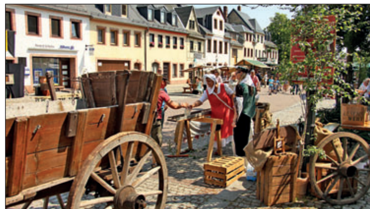
Mit alten Pferdewagen, Kisten und Holzrädern aufwändig gestaltetes Stadtbild

Was ich auf jeden Fall nicht versäumen möchte, ist ein Dankeschön all jenen zu sagen, die dieses Fest zum Erfolg geführt haben. Das sind sehr viele. Mein besonderer Dank gilt dem Team vom Mittelsächsischen Kultursommer e.V., der Polizei, dem Sicherheitsdienst Vorpahl, dem Rathaus-Organisationsteam und dem Städtischen Bauhof.