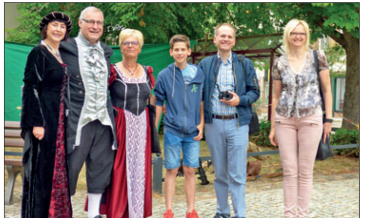
Ehregäste aus Nettetal beim Stadtrundgang