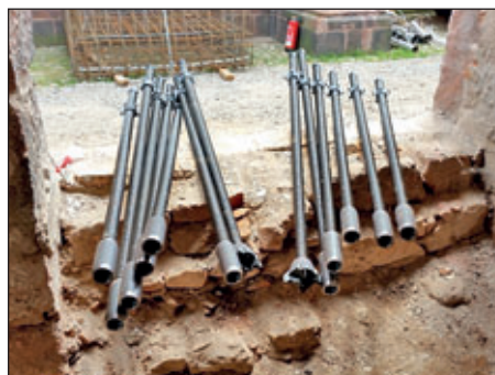
In der Bibliothek sind die Vorbereitungsmaßnahmen zum Einbau der Mikropfähle ange laufen.