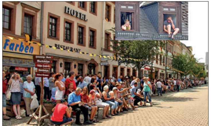
Warten auf den Fürstenzug – auch in den Dachgauben (Bild in Bild)