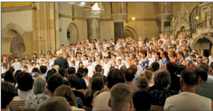
Schüler der Regenbogen-Grundschule beim Chorkonzert in Leipzig