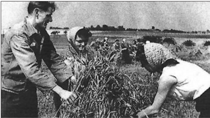
hier werden auf dem Feld Garben zusammengebunden

Damit wurden landwirtschaftliche Produktionsgenossenschaften (LPG) zugelassen. Die LPG wurden in einer Gründungsversammlung errichtet, mussten sich ein Statut nach gesetzlich vorgeschriebenem Musterstatut geben und wurden durch staatliche Organe bestätigt. Mitglied einer LPG konnten nicht nur Bauern mit eigener Wirtschaft werden, sondern auch Landarbeiter und andere Bürger. Es wurden zunächst drei verschiedene Typen gebildet: Typ I, Typ II und Typ III. Je nach Typen wurden von den Bauern dabei ihr Boden (I), dazu ihre Maschinen (II) und dazu der gesamte landwirtschaftliche Betrieb mit Vieh, Maschinen und Gebäude (III) in die Genossenschaft eingebracht. Die Bauern mussten darüber hinaus Bargeld einbringen (Inventarbeitrag). LPG des Typ III waren zunächst selten, weil es an ausreichend großen Stallungen mangelte. Viele LPG wandelten sich erst später oftmals unter Druck von Partei und Staat vom Typ I oder Typ II in den dominierenden Typ III um. Wie war es damit in der 1950 gegründeten Großgemeinde Steudten mit den Orten Biesern, Fischheim, Seebitzschen, Sörnzig, Steudten, Zaßnitz und Zöllnitz bestellt? Hier gab es zu der Zeit 65 landwirtschaftliche Betriebe mit 650 ha landwirtschaftlicher Nutzfläche (LNF).