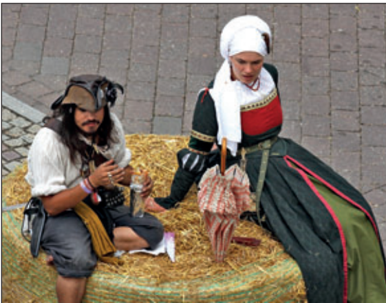
Picknick auf Stroh