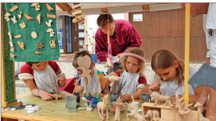
Kinderbelustigung: Malen, Basteln, Mittelalterliche Spiele, Graffiti, Reiten, Bogenschießen – das Angebot war groß