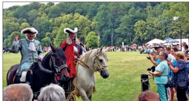
Vorstellung der sächsischen Könige und Markgrafen auf dem Reitgelände in Seelitz