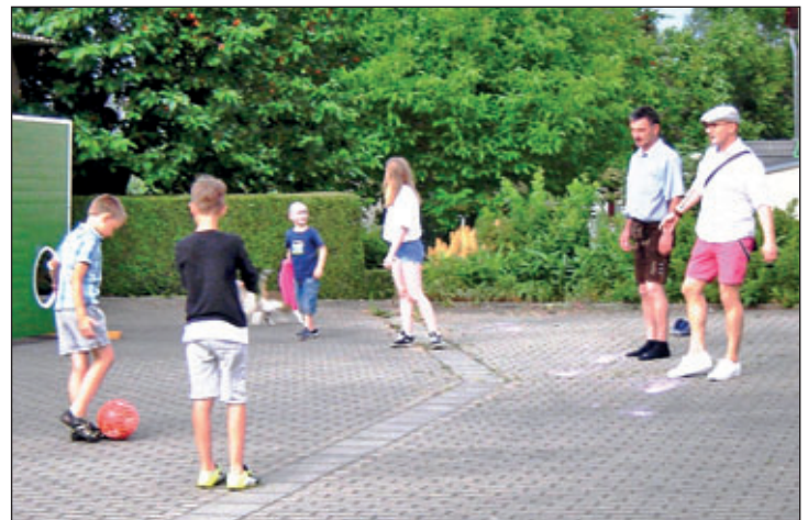
Torwandschießen, Vorbereitung auf die WM?