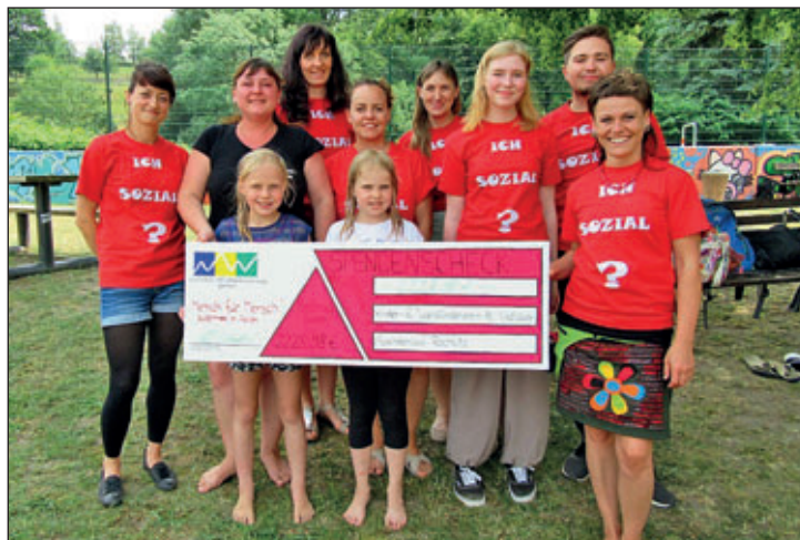
Übergabe des symbolischen Spendenschecks am 08.06.2018 in Rochlitz

Unter diesem Motto fand am 25. April 2018 der Landesaktionstag des Bereiches „Mensch für Mensch“ der Landkreis Mittweida Krankenhaus gGmbH auf dem Sportplatz der Turnhalle „Am Regenbogen“ in Rochlitz statt. Erstmals wurde der Aktionstag in dieser Form von den derzeit über 100 Jugendlichen, die sich sachsenweit im Freiwilligen Sozialen Jahr über die LMK gGmbH engagieren, auf die Beine gestellt. Hauptaktion an dem Tag war ein Spendenlauf, bei dem die Freiwilligen und zahlreiche Schüler*innen der Rochlitzer Grundschule, des Gymnasiums, der Lernförderschule sowie dem DRK Hort und dem Kinder- und Jugendförderverein St. Nikolaus e.V. ihren sportlichen Ehrgeiz für einen guten Zweck unter Beweis stellten.