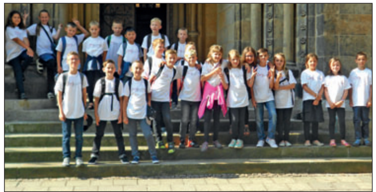
Gruppenfoto vor der Peterskirche