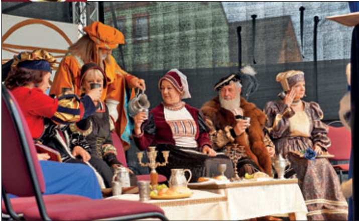
Historisches Festspiel auf der Marktbühne