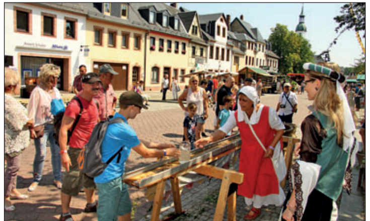
Maßkrug-Schieben, ein Gaudi für Jung und Alt