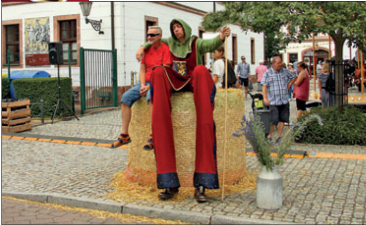
Stelzenläufer, Gaukler und Akrobaten belebten Straßen und Plätze