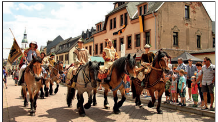
Zweimal umrundete der lebendige Fürstenzug zu Dresden den Rochlitzer Marktplatz