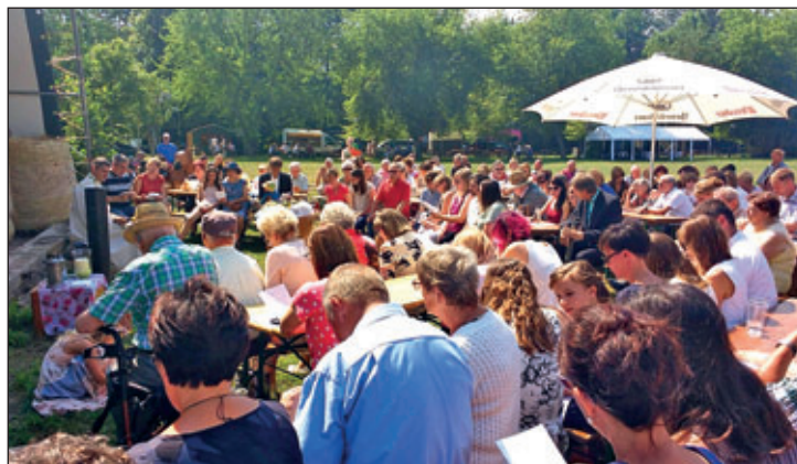
Open-Air-Gottesdienst in Seelitz