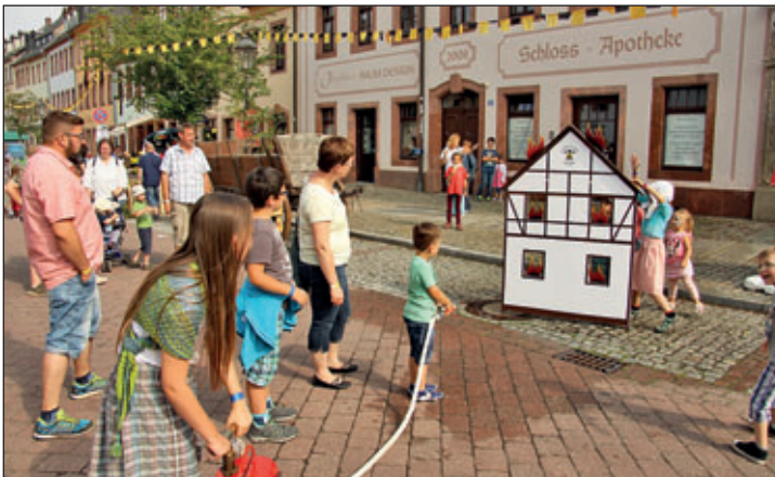
Inszenierte Brandlöschung mit Handpumpe