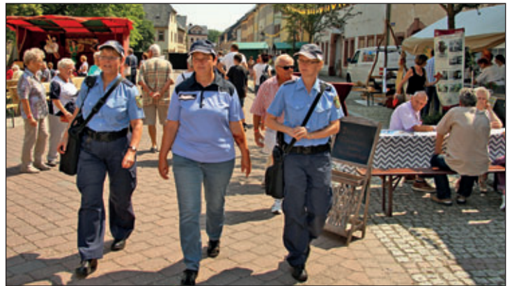
Immer präsent: Bedienstete der Sächsischen Sicherheitswacht, des Polizeireviers (Foto) und des Sicherheitsdienstes Vorpahl (Stöbnig)