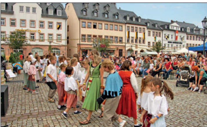
Tanzaufführung von Schülern der Regenbogen-Grundschule