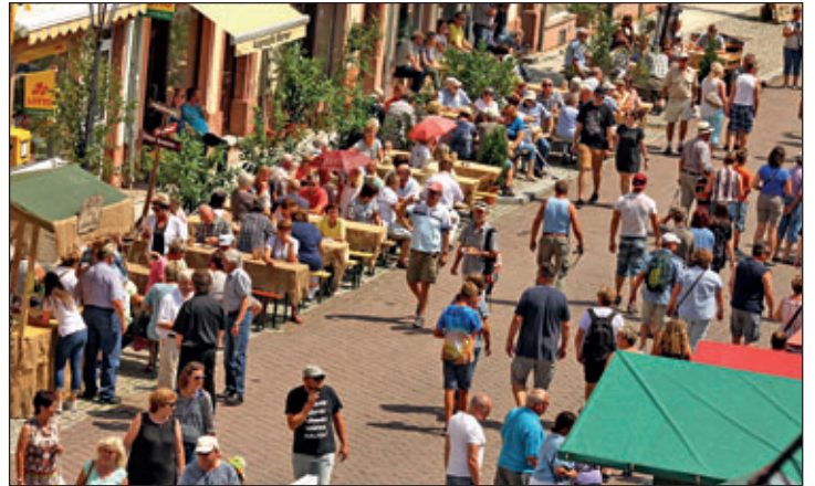
Flanieren und Genießen – Blick auf die Rathausstraße