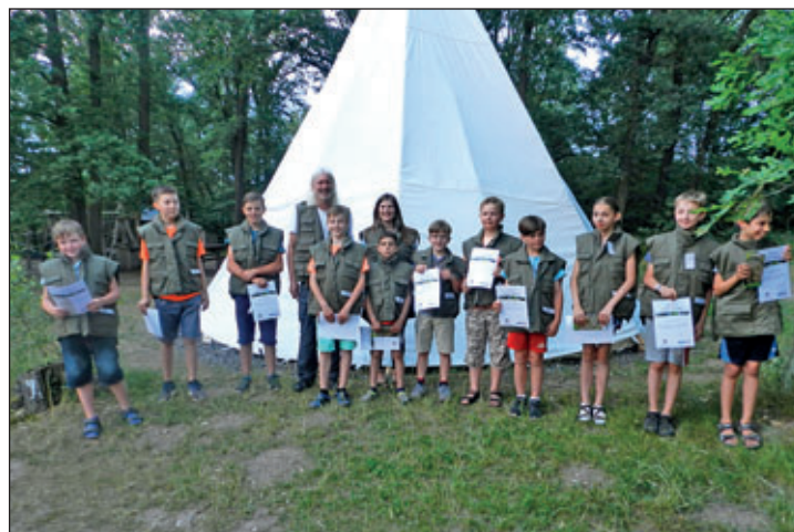
Nachwuchsruanger erhalten Zertifikate als Junior Ranger.

In Kooperation mit dem Geopark Porphyryland. Steinreich in Sachsen e.V. organisiert die Volkshochschule Muldentale das Junior Ranger Programm, in dem Kinder im Alter von zehn bis zwölf Jahren für ein Jahr lang mit Umweltexperten die Geoparkregion erkunden. Etwa jeden vierten Samstag treffen sich die jungen Abenteurer in der Gruppe und erkunden einen anderen Ort in der Region Muldentale und lernen ein neues Themengebiet kennen. Das Ausbildungsjahr schließt traditionell mit einem Naturcamp ab, bei dem die Kinder ihre Zertifikate und Junior Ranger Westen erhalten. Bereits seit 2011 werden auf diese Weise Junior Ranger ausgebildet.