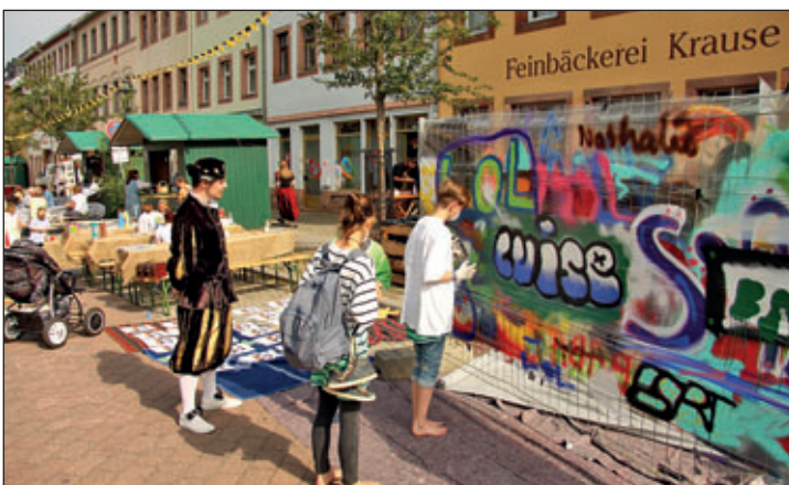
Vom JUGENDladen installierte Graffitiwand in der Hauptstraße