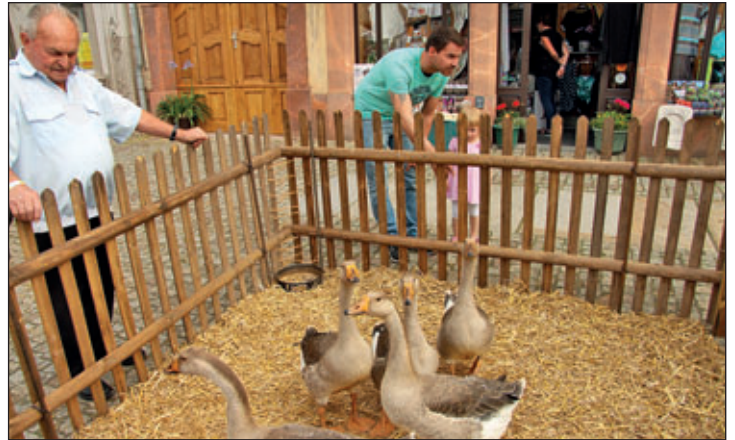
Lustiges Geschnatter – Tiergatter mit Höckergänsen