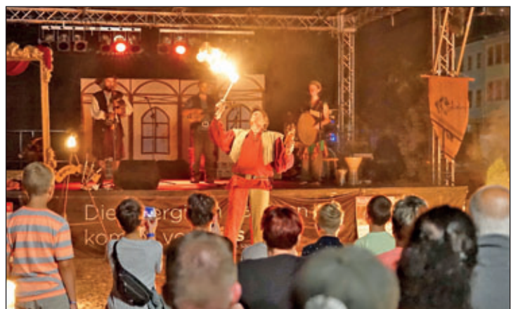
Feuershow zum Tavernenabend