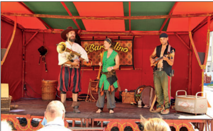
Auftritt der Gruppe Bardolino am Topfmarkt