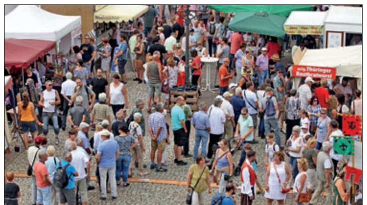
Bratwurst und Eis ging immer – um die Mittagszeit waren die Gastronomieanbieter mächtig gefordert.