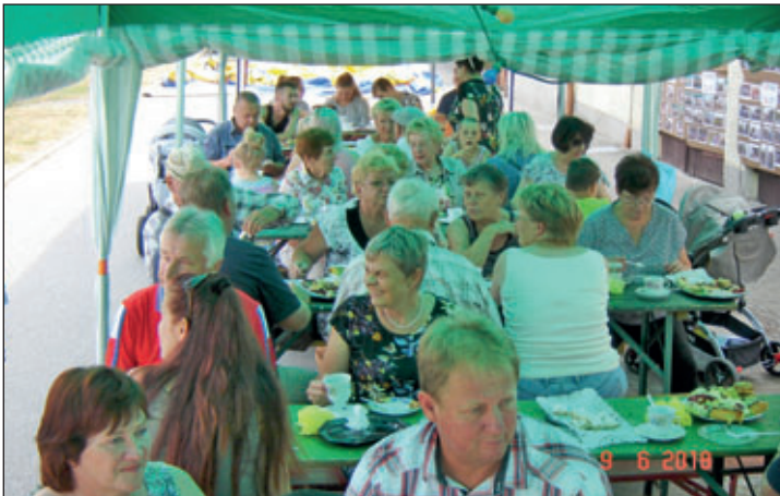
Beginn des Straßenfestes mit Kaffee und Kuchen

Über 100 Gäste hatten sich zum Straßenfest eingefunden, die alle einen überdachten Platz gefunden haben. Auffällig war, dass viele Familien mit Kleinkindern und Kindern im Schulalter gekommen waren und das Fest sichtlich genossen.