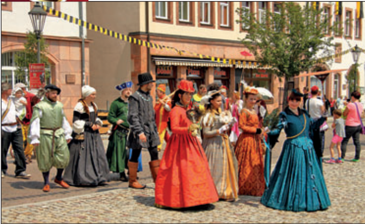
Einzug des Festspielensembles auf dem Marktplatz