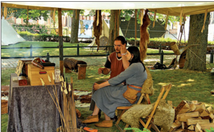
Germanen-Lager am Topfmarkt