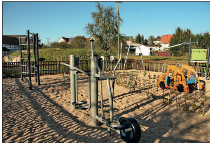
Spielplatz in Penna wurde mit neuen Spielgeräten ausgestattet. Die Investitionen belaufen sich auf rund 56.000 €.