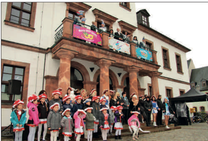
Rathaussturm des KCR am 11.11.