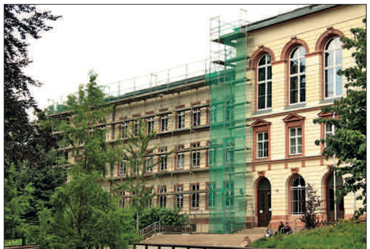
Für rund 115.000 Euro wurden von der Stadt Dachdeckungsarbeiten am Schulgebäude Oberschule „An der Mulde“ vergeben.