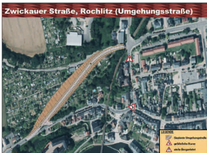
Erster Entwurf zur Weiterführung der Stadtkerntangente zur Zwickauer Straße