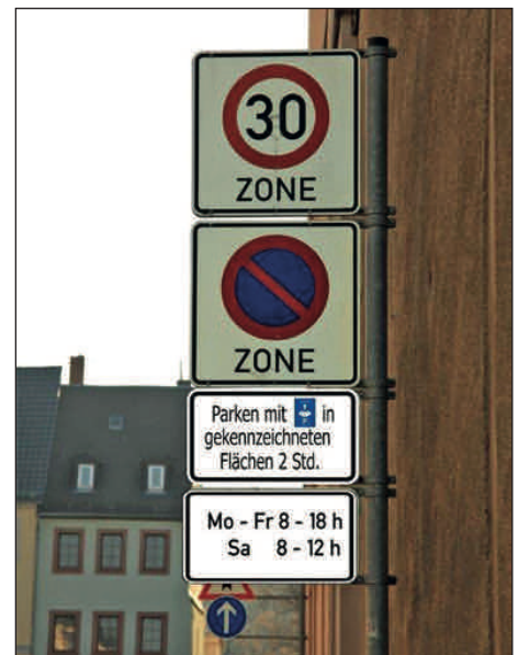
Die zeitlich begrenzte Parkdauer in der Rochlitzer Innenstadt wurde von bisher einer Stunde auf zwei erhöht. Für die Wochenendtage ist die Zeitbeschränkung gänzlich aufgehoben.