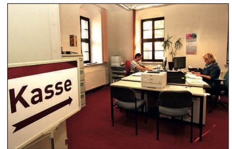
Verwaltung wird bürgerfreundlicher – Stadtkasse jetzt barrierefrei im Erdgeschoss zugänglich.

Bei der Stadtverwaltung gab es 2017 einige Veränderungen. Mehrere Stellen wurden neu besetzt, die Ämterstruktur angepasst. Das Bauamt wurde um die Bereiche Liegenschaften und Gebäudemanagement erweitert und durch eine neue Amtsleiterin verstärkt. Ferner wurden neben einem neuen Schwimmmeister ein Bauhofmitarbeiter und ein Hausmeister eingestellt. Wir freuen uns auch, dass wir eine Auszubildende nach erfolgreicher Lehrzeit als Verwaltungsfachangestellte übernehmen konnten.