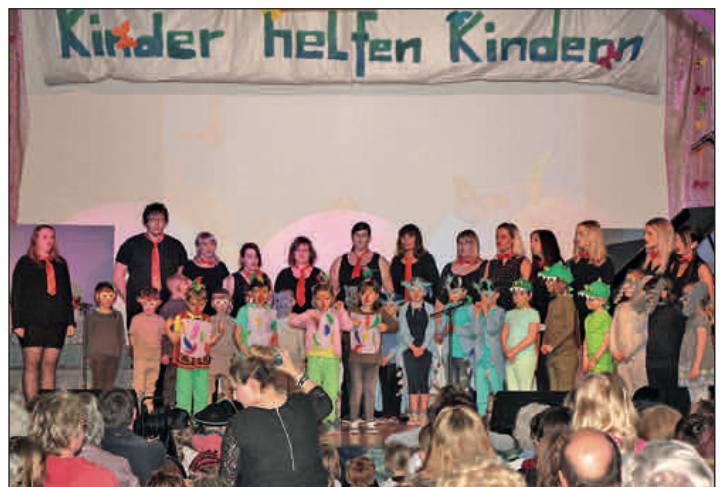
Kinder engagieren sich für Kinder – 10. Benefizkonzert der Mittelschule „An der Mulde“ im Bürgerhaus. 6199,57 Euro wurden an die Vertreter des „Elternvereines krebskranker Kinder Chemnitz e.V.“ übergeben.