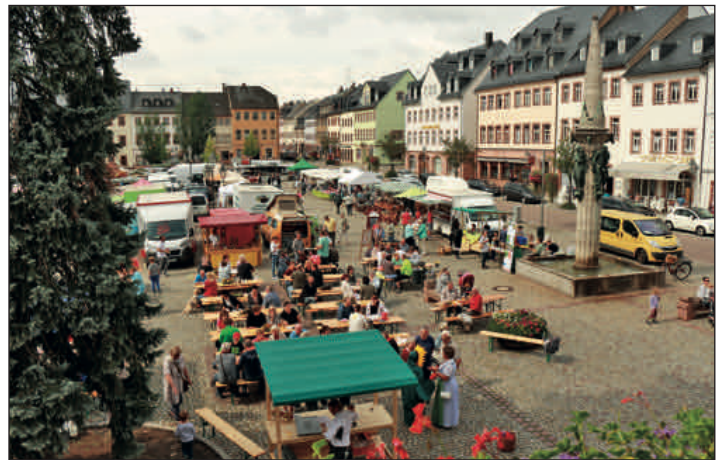
Der Rochlitzer Regionalmarkt startete in seine erste Saison. Eine Bürger-Initiativgruppe war Wegbereiter, um regionalen Erzeugern aus Landwirtschaft, Handwerk und Kunst auf dem Rochlitzer Marktplatz eine Plattform zu bieten, ihre Warenvielfalt ein Stück weit vorzustellen. Von April bis Oktober fanden 7 Themenmärkte statt, die sich bei den Bürgern zunehmender Beliebtheit erfreuten.