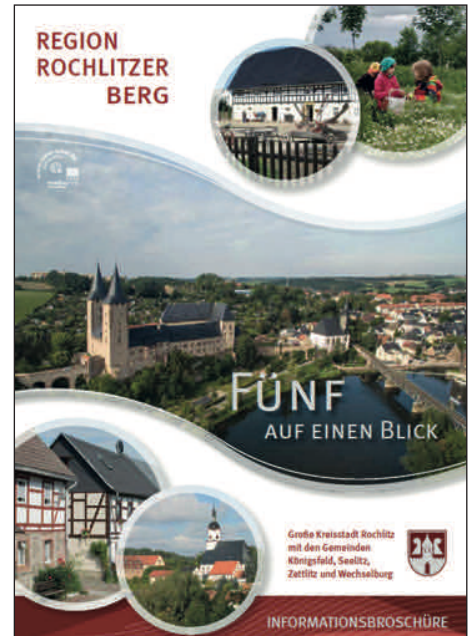
„Fünf auf einen Blick“ – Stadt veröffentlichte neue Bürgerbroschüre. Rund 5200 Exemplare sind bislang nachgefragt worden.