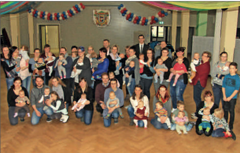
Zum Baby-Neujahrsempfang im Bürgerhaus begrüßte Oberbürgermeister Frank Dehne die anwesenden Eltern und Neugeborenen, die im Vorjahr das Licht der Welt erblickten.