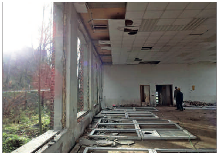
Rückbau ehemalige Kunststofftechnik in der Waldheimer Straße