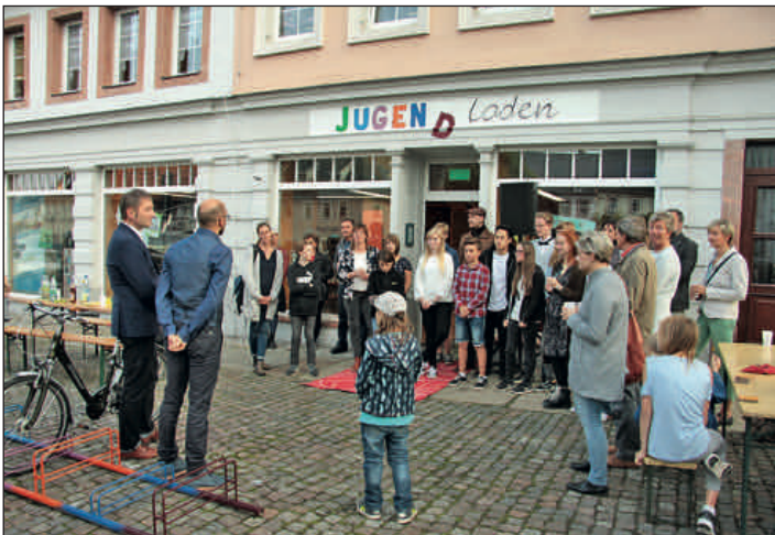
Freizeitzentrum Schlossau heißt jetzt Jugendladen. Im Foto: Feierliche Eröffnung des neuen Domizils am Clemens-Pfau-Platz