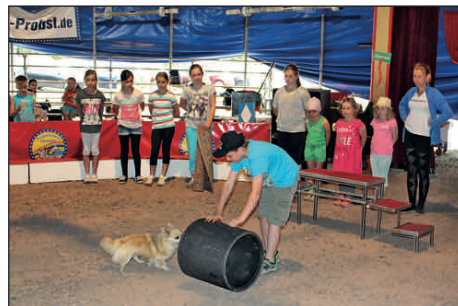
Zirkusprojekt der Regenbogen-Grundschule, der Oberschule „An der Mulde“ und der Kita „Die kleinen Strolche“ begeisterte Jung und Alt.

Eine Reihe von Veranstaltungen prägte das Jahr 2017. Seien es das Internationale Kugelstoßmeeting, die Etablierung des Regionalmarktes mit sieben Markttagen, die Gewerbechau, das Hexenfeuer, die Performance zum Stein, das Feuerwehrfest, das Stadtbadfest, der Händlerherbst oder das Begegnungsfest. Auch der Bergtriathlon, verschiedene Kirchenkonzerte, die Faschingsveranstaltungen und die Weihnachtsmärkte auf Marktplatz und Schloss komplettierten den Jahreskulturkalender. Beim jährlichen Babyempfang wurden die neuen Rochlitzer begrüßt, bei der Ehrenamtsauszeichnung verdiente Bürger gewürdigt sowie beim Sportlerempfang erfolgreiche Athleten geehrt.