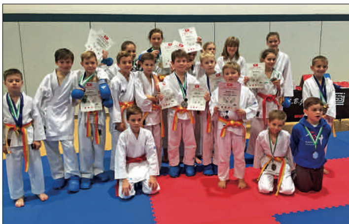
Karate Nachwuchsstarter beim letzten Turnier des Jahres

Rochlitzer Anzeiger im Internet: www.rochlitz.de