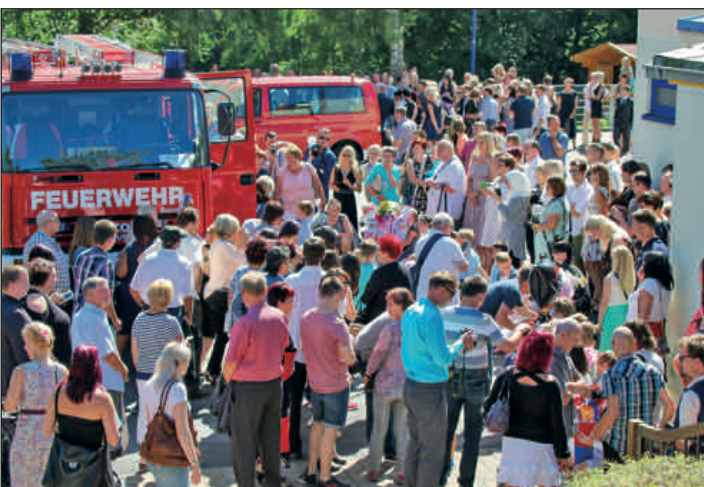
Schulanfang in der Regenbogen-Grundschule – 63 Erstklässler wurden aufgenommen. Im Foto: Feuerwehr Rochlitz rückt mit süßer Fracht zur Sporthalle Am Regenbogen aus