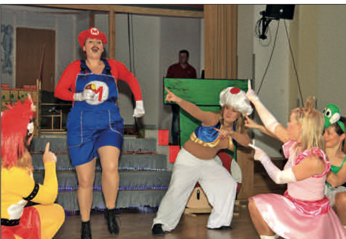
Unter dem Motto "Der KCR lädt Euch ein, der Held Eurer Kindheit zu sein!", hatte der Karneval-Club Rochlitz zu seiner 54. Saison eingeladen. Zu den fünf Veranstaltungen im Bürgerhaus einschließlich Funkencup konnten über 1000 Besucher begrüßt werden.