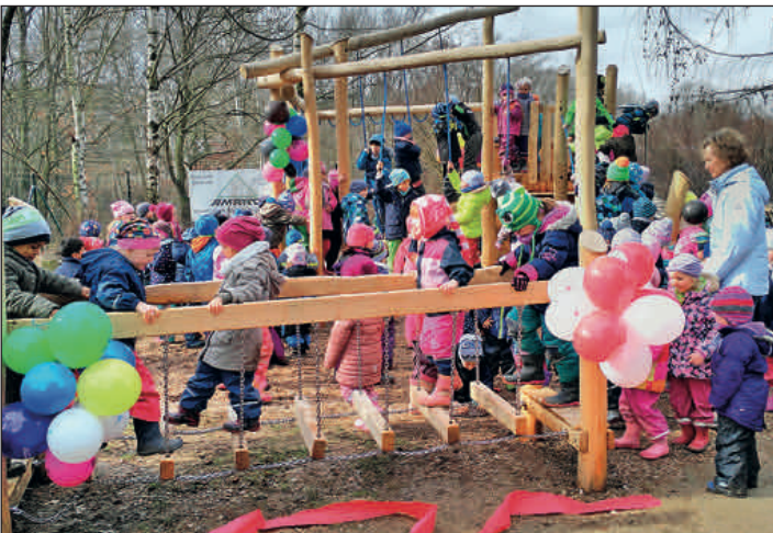
Für die Kinder der DRK-Kita „Die kleinen Strolche“ erfolgte die Freigabe einer neuen Spielanlage zum Klettern, Rutschen, Hangeln und Balancieren.