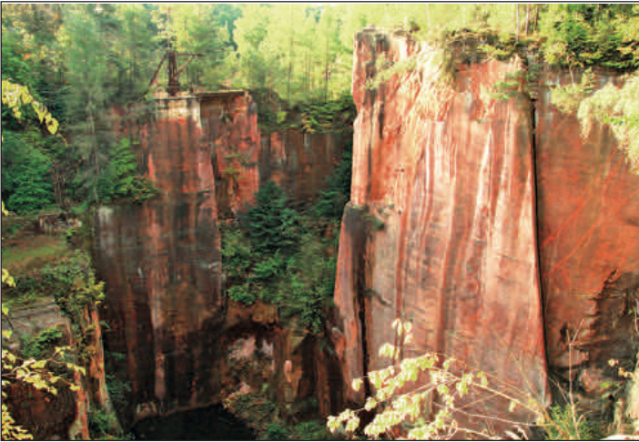
Rochlitzer Porphyrtuff wird erneut von der Akademie für Geowissenschaften und Geotechnologien mit dem Prädikat „NATIONALER GEOTOP“ ausgezeichnet.