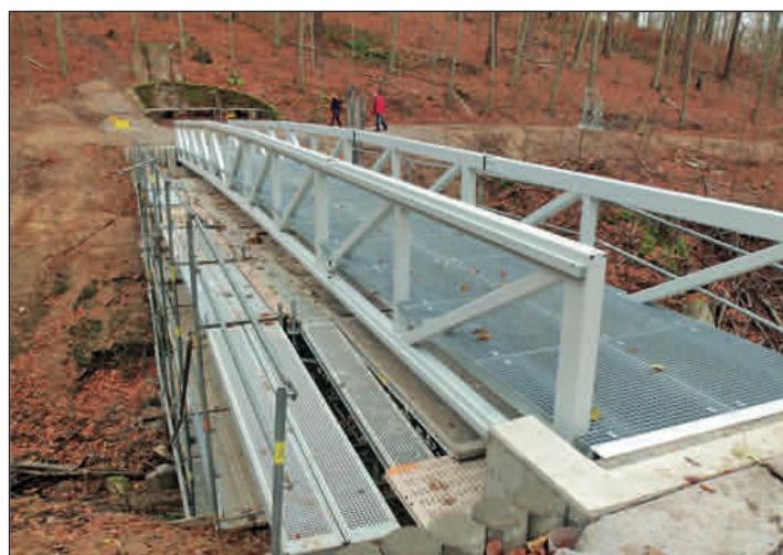
Mordgrundbrücke unmittelbar vor Fertigstellung. Die offizielle Freigabe erfolgt am 15. Dezember ab 14:00 Uhr.