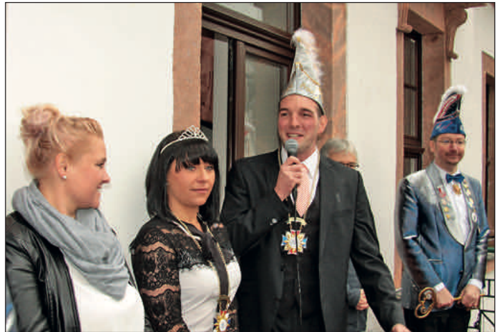
Vorstellung des neuen Prinzenpaares