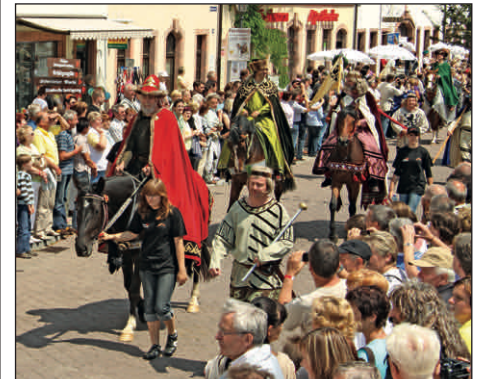
Die Vorbereitungen zum Fürstentag zu Rochlitz und Seelitz 2018 sind angelaufen. Veranstaltungstermin: 15. bis 17. Juni 2018

Chancen und Risiken in einem unausgewogenen Verhältnis erscheinen. Dazu werde ich demnächst noch ausführlich berichten.