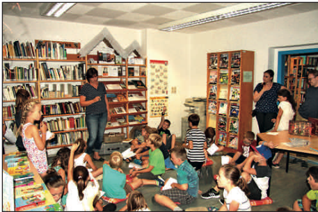
Bibliotheksgebäude in der Schulgasse wird in den kommenden 2 Jahren umfassend saniert und modernisiert. Interimsstandort der Bücherei ist die Sternstraße 1.

auf einem Blick“, welche gemeinsam mit den Gemeinden der Verwaltungsgemeinschaft und Wechselburg erstellt wurde, erhalten Bewohner und Auswärtige einen guten und schnellen Überblick über Institutionen, Vereine und die vielfältigen Freizeitangebote in unserer Region.