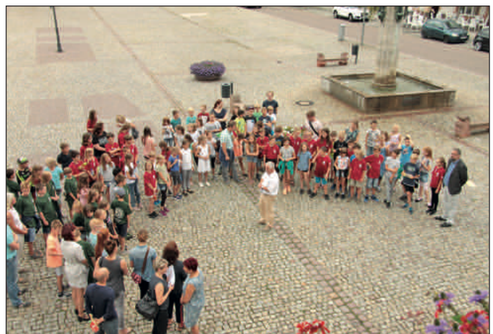
Zum Kennenlernen ihrer Schulstadt, inklusive der Freizeitangebote, hatte die Stadtverwaltung die neuen Fünftklässler der Oberschule „An der Mulde“ und des Johann-Mathesius-Gymnasiums zu einer Schüler-rallye eingeladen.