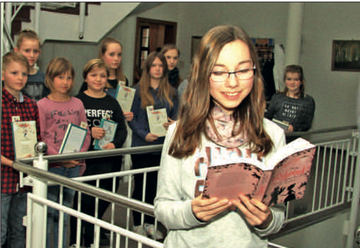
Zum Vorlesewettbewerb der Sechstklässler im Rochlitzer Rathaus hatten sich aus den regional teilnehmenden Schulen 11 Mädchen und ein Junge qualifiziert.