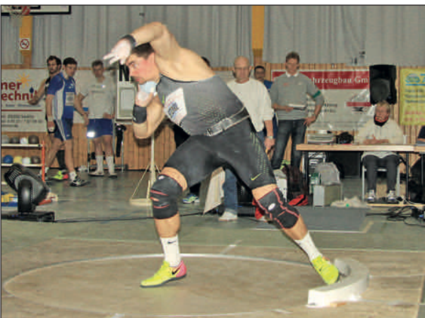
11. Sparkassen-Kugelstoßmeeting in Rochlitz David Storl mit Glücksgefühlen – Kugel fliegt zum Hallenrekord