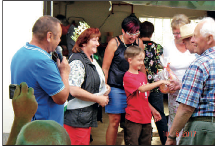
Noßwitz feierte im Juni Kinder- und Straßenfest.