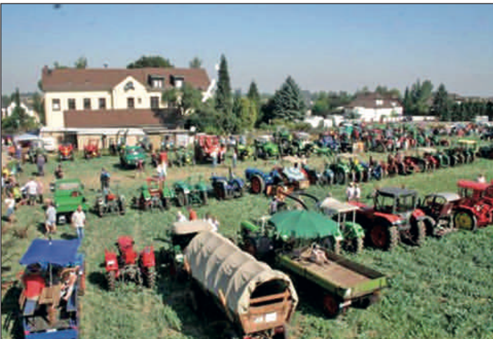
Die Rochlitzer Ortsteile Breitenborn und Wittgendorf hatten sich am Wettbewerb „Unser Dorf hat Zukunft“ beteiligt und einen dritten Platz belegt. Im Foto: Traktorentreffen in Breitenborn