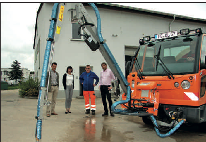
Das Unkrautvernichtungsmittel Glyphosat hat in Rochlitz ausgedient. Die Stadt rückt wuchernden Unkräutern mit einem für rund 50.000 Euro neu angeschafften Heißwasserunkrautvernichter zu Leibe.