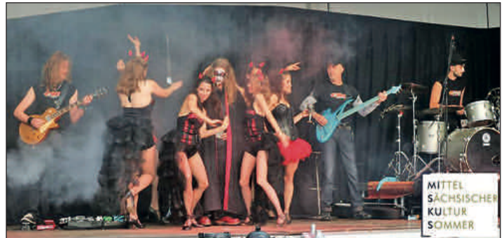
Performance zum Stein - über 700 Zuschauer waren bei „Faust Die Rockoper“ im Porphyrbruch dabei