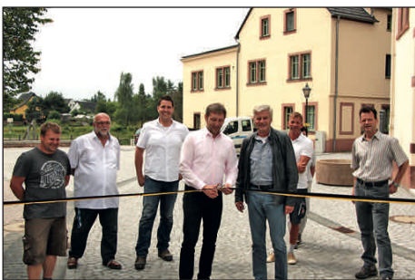
Feierliche Übergabe des sanierten Mühlplatzes

Die wesentlichsten Bauvorhaben, welche in diesem Jahr abgeschlossen werden konnten, sind die Sanierung des Ostdachflügels der Oberschule „An der Mulde“, der Neubau des Mühlplatzes, die Sanierung der Stützmauer in der Hohen Gasse, der Abriss des Wohnheimes in der Mühlenstraße sowie der Rückbau der ehemaligen Kunststofftechnik in der Waldheimer Straße mit anschließender Renaturierung. Auch der Abschluss der Hochwasserschadenbeseitigungsmaßnahmen mit Deckensanierung des Muldeinsel-Festplatzes sowie die Fertigstellung des neuen Vereinsheimes für den VfA konnten in 2017 erfolgen. Die kürzlich fertiggestellte Mordgrundbrücke erlaubt jetzt wieder die uneingeschränkte Nutzung des Zimmermannweges im Rochlitzer Bergwald.