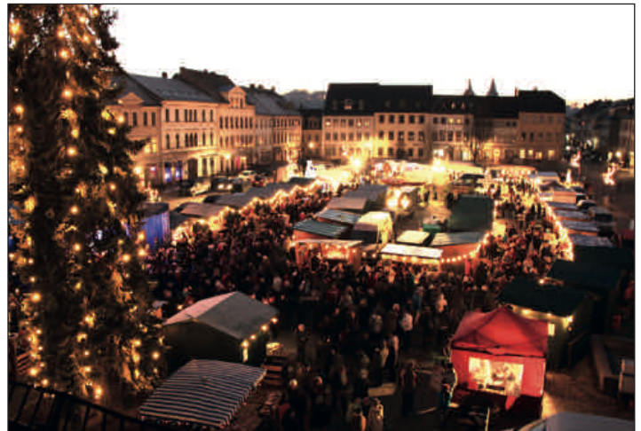
Rochlitzer Weihnachtsmarkt lockte tausende Besucher in die Innenstadt