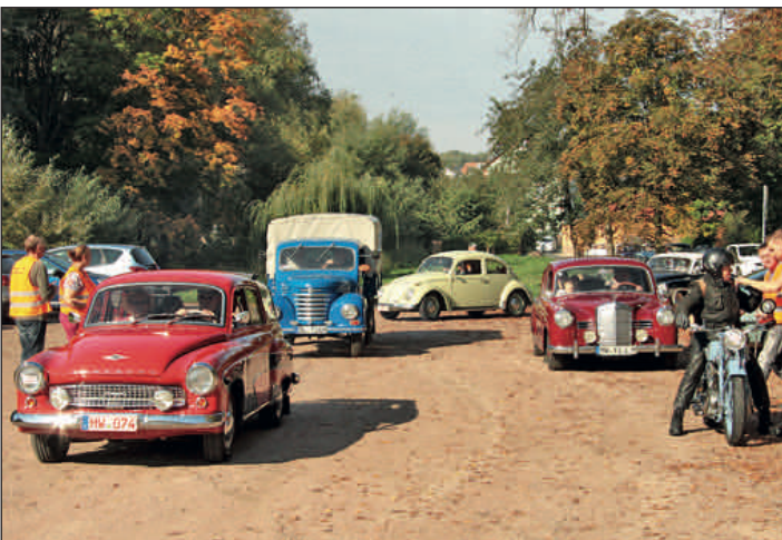
Über 150 Teilnehmer und jede Menge Besucher begrüßten die Organisatoren der 49. ADAC-Oldtimerrallye „Rund um den Rochlitzer Berg“. Im Foto: Punktgenaues Anhalten war beim Rückwärtsfahren am Checkpoint Bleiche gefordert.