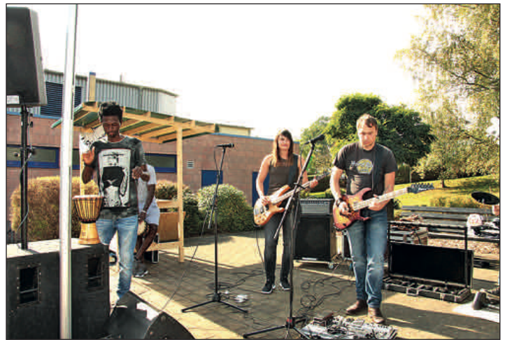
Gelebte Begegnung mit Flüchtlingen – miteinander feiern, tanzen, glücklich sein. Diakonisches Werk Rochlitz organisierte Begegnungsfest an der Sporthalle Am Regenbogen.