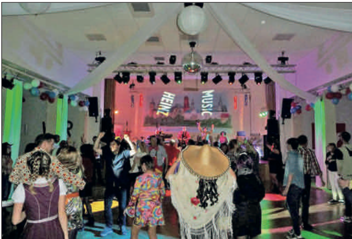
Partystimmung mit der Heinz-Band