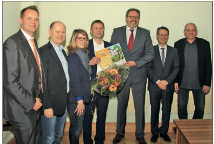
Beim Wettbewerb Ab in die Mitte! Die City-Offensive Sachsen wurde die „Rochlitz-App“ mit einem Sonderpreis geehrt. Der mit 5.000 Euro dotierte Preis ist eine Auszeichnung für die Rochlitzer City-App, die vom ortsansässigen Unternehmen NrEins AG entwickelt wurde.