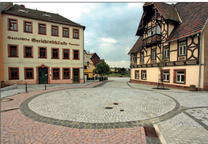
Mühlplatz zeigt sich von seiner schönsten Seite – 420.000 Euro hat die Stadt investiert, um das Areal wieder auf Vordermann zu bringen.