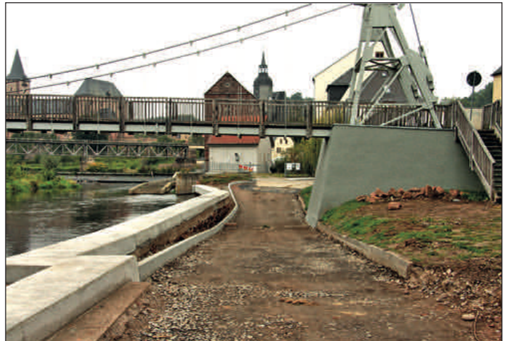
Baumaßnahme Muldeinsel – Für 131.000 Euro wurde eine Deckensanierung am Fahrschulplatz, die Sanierung der Fahrbahn auf 150m Länge ab Brücke (Foto) sowie eine partielle Reparatur der Ufermauern im Bereich Hängebrücke vorgenommen.