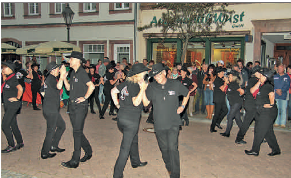
Auftritt der Red Stone Liners zum Händlerherbst in der Rathausstraße

sowie dem Ablegen des „Deutschen Tanzsportabzeichens“ von „Bronze“ bis „Gold mit Ehrenkranz“ waren hierbei nur zwei Stationen. Sehr viel haben wir auch auf unzähligen Linedance Partys von befreundeten Tanzlehrern und bekannten Choreografen/innen dazu gelernt.