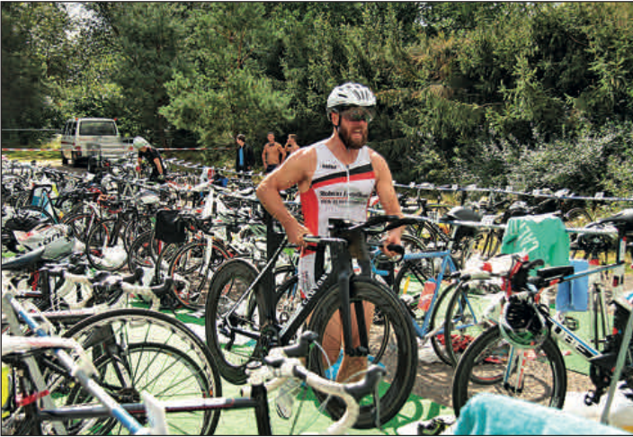
Sportevent Bergtriathlon erlebte 2. Auflage nach Neuanfang. 162 Sportler nahmen an den Triathlon- und Laufwettbewerben teil. Im Bild: Wechselgarten am Baggersee in Biesern