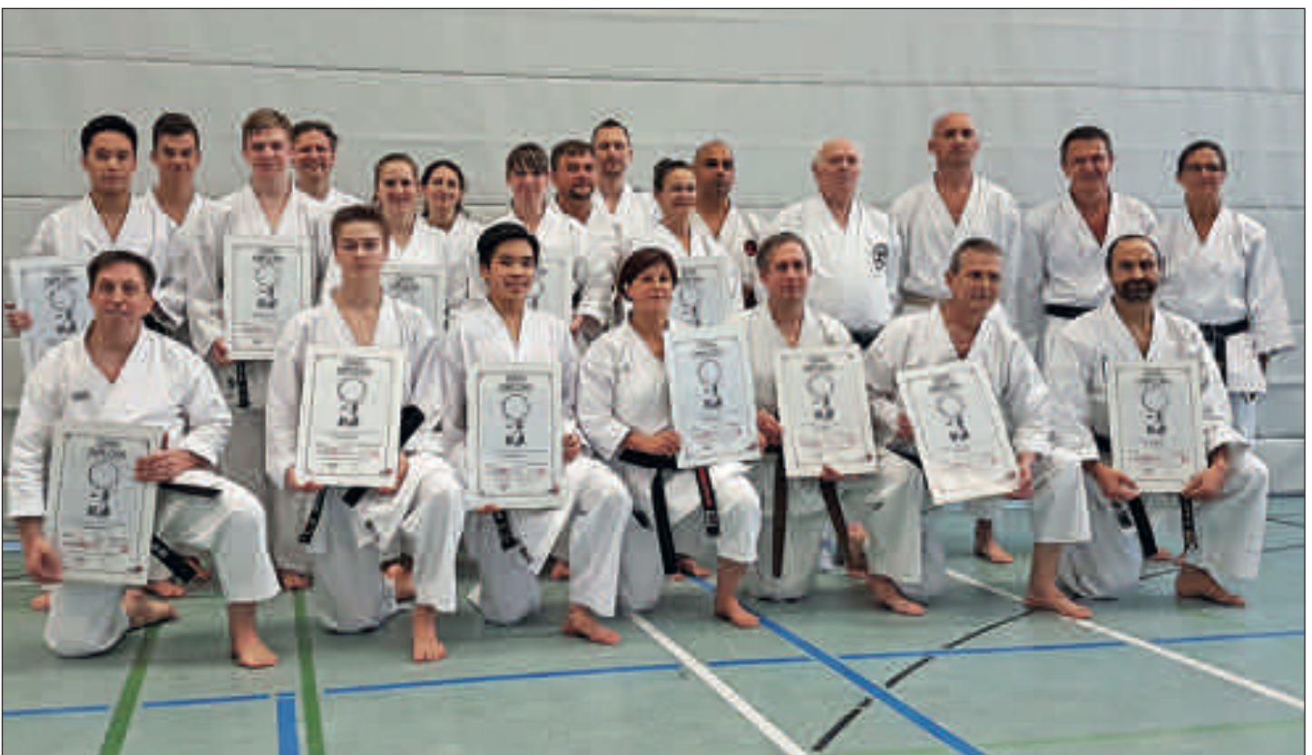
Schwarzgurtprüfung im Rochlitzer Karateverein