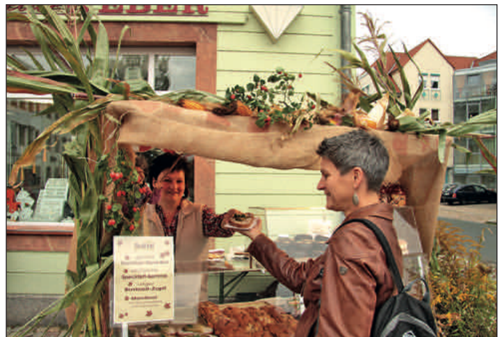
Zum 8. Händlerherbst hatte Mitte September der Rochlitzer Gewerbeverein in die Innenstadt eingeladen. Vielfältige Programmangebote – Modenschauen, Musikdarbietungen und ein Feuerwerk gehörten zu den Höhepunkten des Abends.