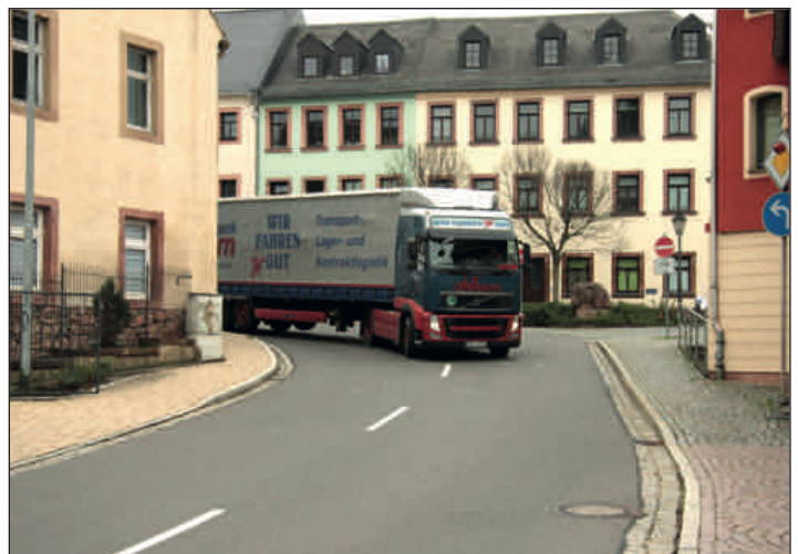
Gefahrenpotenzial - Kurve Leipziger Straße/Zwickauer Straße - allein ein Grund warum die jetzige Streckenführung der B175 überdacht werden sollte.