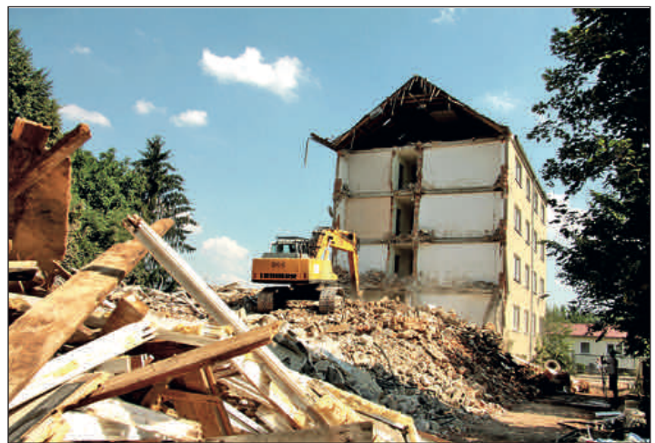
Rückbau Wohnheim Poppitzer Straße