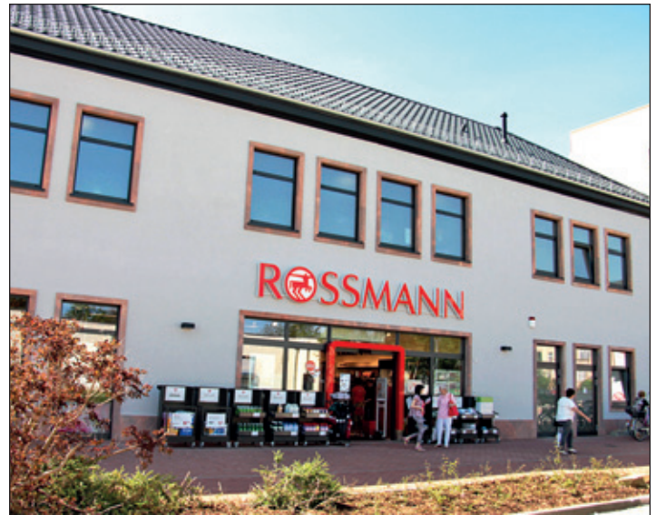
Neu eröffneter Rossmann-Drogeriemarkt in der Gärtnerstraße