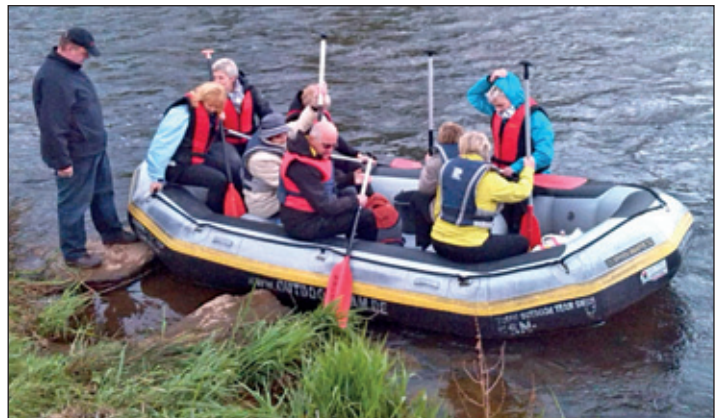
Das erste Schlauchboot startet