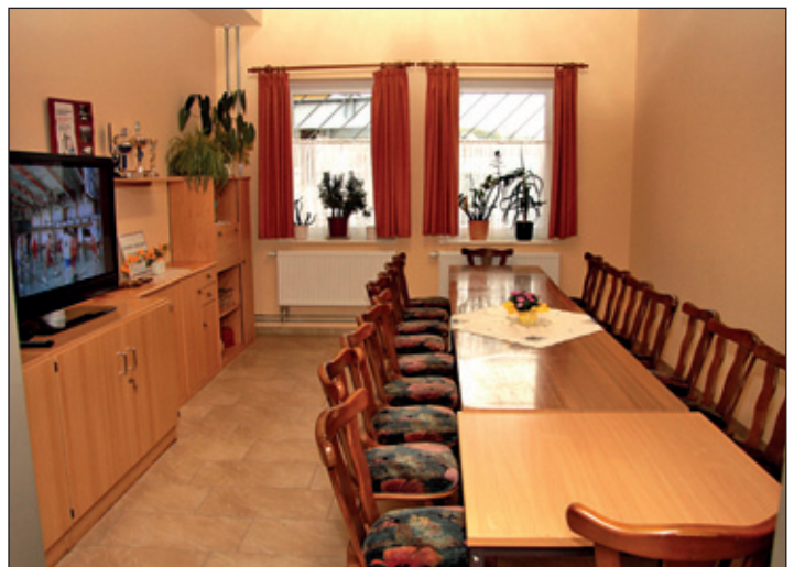
Beratungs- und Klubraum