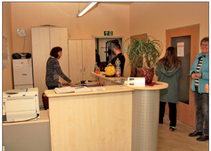
Eingangsbereich mit Empfangstheke