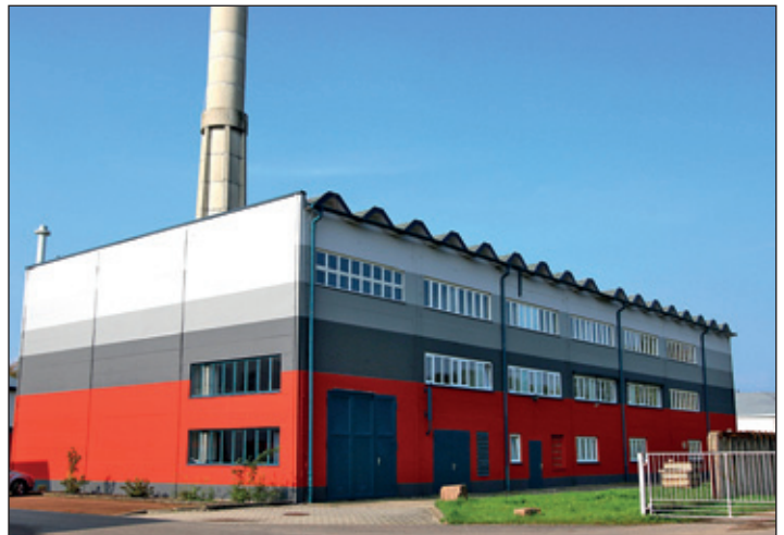
Betriebsstätte der EVR Am Mönchswinkel

Heute versorgt die Energieversorgung Rochlitz rund 1450 Haushalte, das sind 46% aller Haushalte der Gesamtstadt mit sauberer und bequemer Fernwärme, und das alles mit nur 3 Mitarbeitern, die sich rund um die Uhr darum kümmern.