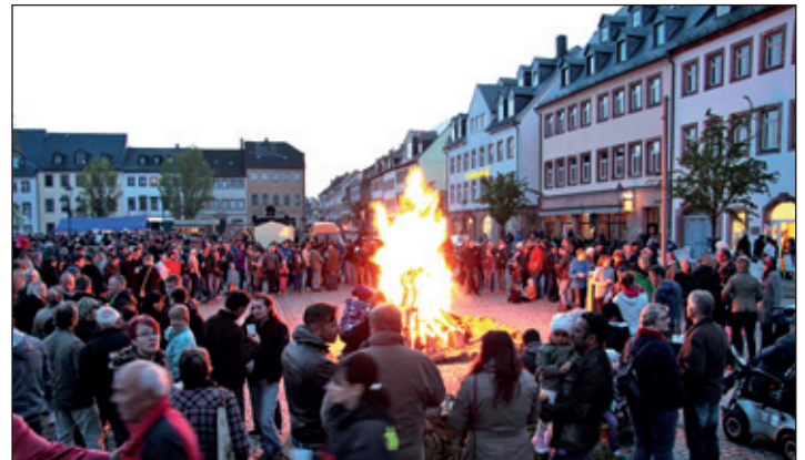
Loderndes Hexenfeuer auf dem Rochlitzer Marktplatz