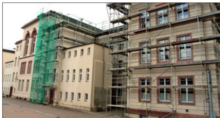
Dachsanierung der Oberschule „An der Mulde“ – momentan erfolgt die flächenhafte Verlegung von Blechbahnen.