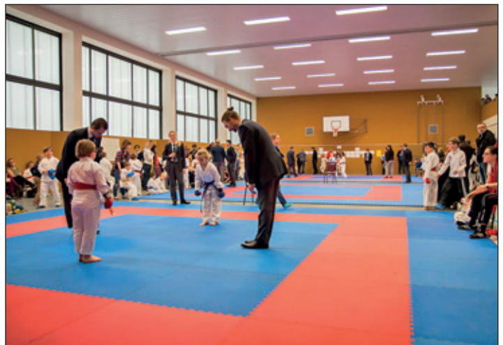
Rochlitzer Team richtet zum 14. Mal die Kreis-, Kinder- und Jugendspiele im Karate aus

Insgesamt konnten die jungen Sportler des Karate-Do Rochlitz e.V. in den 49 ausgekämpften Kategorien 12x Gold, 16x Silber und 35x Bronze erkämpfen. Sie sicherten somit auch den ersten Rang in der Vereinswertung vor den Karatekas aus Schmalkalden (8x Gold, 13x Silber, 14x Bronze) und Meißen (6x Gold, 5x Silber, 4x Bronze). Mit diesem Ergebnis konnte der Verein seine gute Nachwuchsarbeit einmal mehr unter Beweis stellen.