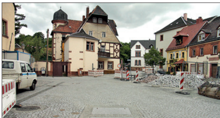
Die Sanierung des Mühlplatzes steht unmittelbar vor dem Abschluss. Als Fertigstellungstermin wird die 2. Juni-Woche avisiert.

Am 15.06.2017 findet eine Sitzung des Planungs- und Bauausschusses statt.