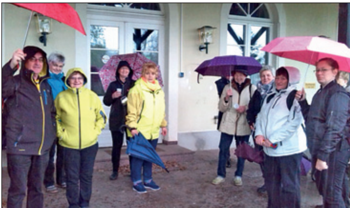
Start bei kräftigem Regen