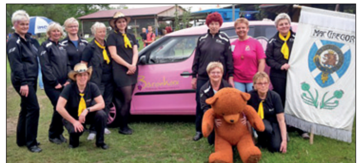
Die Rochlitzer Line dancer mit der Vertreterin des Fördervereins „Bärenherz“ e.V.