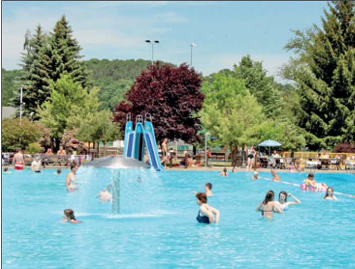
Gelungener Start in die Freibadsaison 2017. In den ersten 14-Tagen im Monat Mai kamen rund 2000 Besucher.

Seit 13. Mai ist das Rochlitzer Freibad geöffnet. Nach anfänglich mäßigen Temperaturen kletterte das Thermometer am letzten Mai-Wochen-