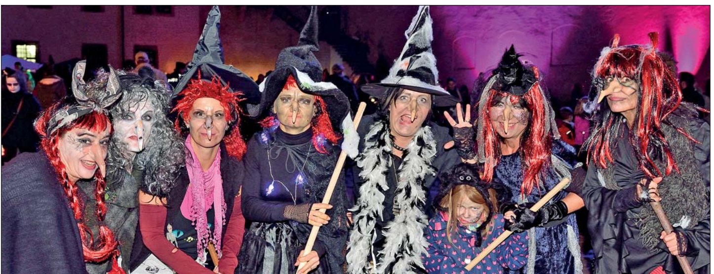
Hexen auf Schloss Rochlitz