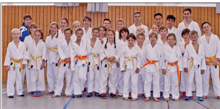
Teilnehmer am Karatetrainingslager

beim Blocken von gegnerischen Angriffen gute Fortschritte, und auch die neue Kata saß nach dem Essen noch. Den Abschluss des Tages bildete ein gemeinsamer Ausflug auf die Bowlingbahn. Hier zeigte sich, dass die Kids als Team an diesem Tag wieder ein Stück weiter zusammen gewachsen sind.