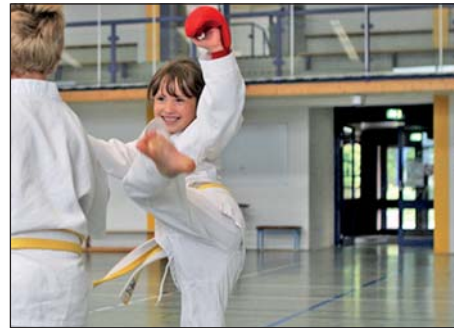
Der Spaß kommt nie zu kurz beim Training

Mittagessen bildeten Kata und Kumite die Trainingsschwerpunkte. Nach der Erwärmung erlernten die jüngeren neue Kumite-Angriffe bei Trainerin Claudia Gabrich. Die erfahreneren Kämpfer feilten gemeinsam mit Trainer Ralf Ziezio an ihrer Schnellkraft, Reaktionsvermögen und verschiedenen Taktiken. Im zweiten Teil erarbeiteten sich die Kids hochkonzentriert eine neue Kata. Alle waren mit großem Ehrgeiz dabei, schließlich sind neue Techniken und Katas immer eine Bereicherung. Viele übten in der Pause eigenständig weiter. Es war dann nicht verwunderlich, dass beim Mittag alle ordentlich hungrig waren. Nach dem Mittagessen standen weitere Trainingseinheiten auf dem Programm. Hier wurden die Schwerpunkte des Vormittags noch einmal wiederholt und erweitert. Alle stellten unter Beweis, dass sie am Vormittag gut aufgepasst hatten. So zeigten sich insbesondere