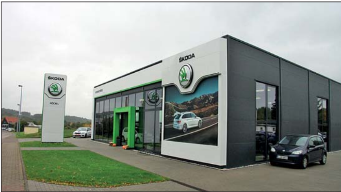
Neuerrichtetes Skoda-Autohaus in der Colditzer Straße 3A.