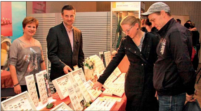
Schmuckpräsentation von Juwelier Weber Rochlitz