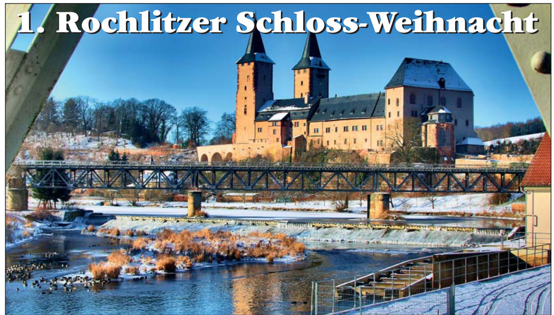
Winteraufnahme vom Schloss Rochlitz

Das Rochlitzer Schloss ist eingetaucht in warmen Lichterschein, sacht fällt der Schnee zwischen den dicken Mauern in den Schlosshof herein, hier stimmen Kinder „O Tannenbaum ...“ an, dort hört man die Posaunen tönen das Auge erblickt vom Festlichen allerlei Schönen. Überall umher liegt ein herrlicher Duft von Glühwein und weibnachtlichen Köstlichkeiten in der Luft - ein winterliches Märchenschloss entzückt Jung wie Alt und Besucher aus Nah und Fern schon bald.