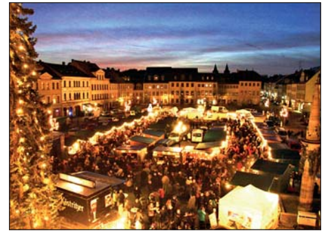
Rathausblick auf den Rochlitzer Weihnachtsmarkt

Der Rochlitzer Weihnachtsmarkt wird veranstaltet von der Stadtverwaltung und dem