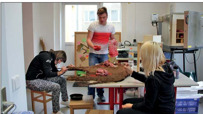
Schüler der Euro-Akademie bei den Vorbereitungen zur Gespensternacht