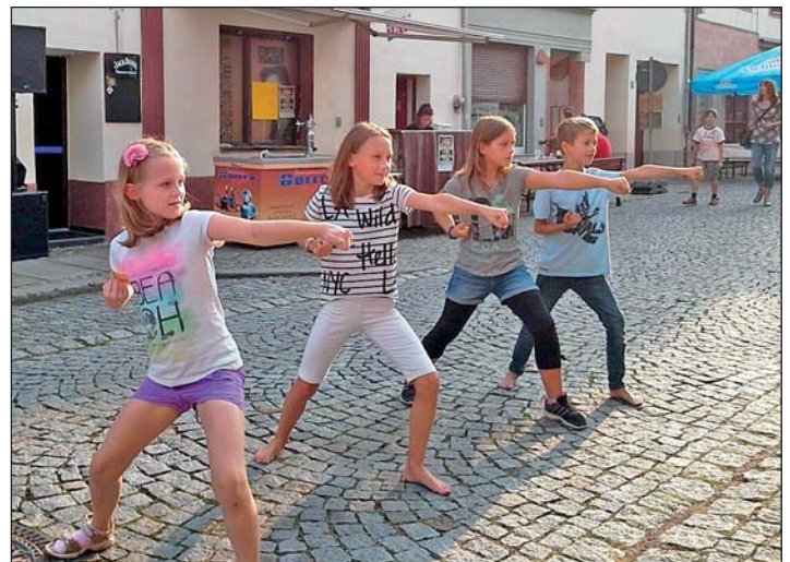
Spontanvorführung der Kids

Rochlitzer Anzeiger im Internet: www.rochlitz.de