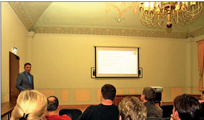
Händler und Gewerbetreibende zu Gast bei Oberbürgermeister Frank Dehne im Rathaus.