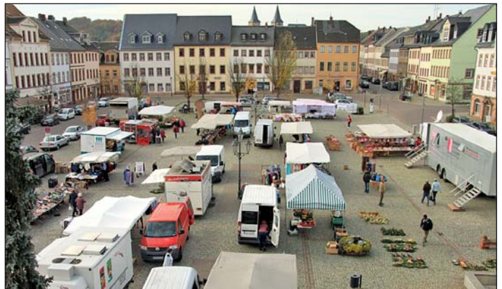
Dienstags und donnerstags sorgt der Rochlitzer Wochenmarkt für eine Belebung der Innenstadt.