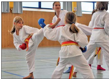
Angreifen, Blocken und mehr

Kürzlich organisierte der Rochlitzer Karateverein ein Trainingscamp. Pünktlich halb neun versammelten sich 29 junge Karatesportler aus Rochlitz, Borna und Senftenberg im Alter von 5-16 Jahren, um gemeinsamen einen lehr- und natürlich auch spaßreichen Trainingstag zu verbringen. Bis zum