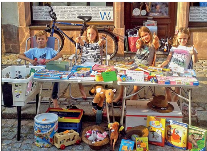
Kids engagieren sich für ihren Karateverein