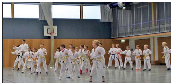
Trainingslager in Rochlitz