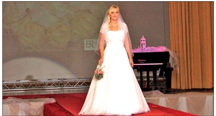
Brautmodenschau der Fa. Sunflower aus Kohren-Sahlis