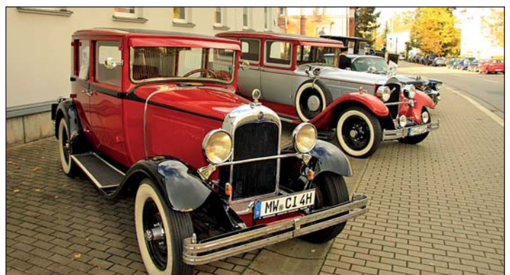
Die „Hochzeitskutschen“: vom Citroen-Oldtimer über Cadillac bis zur Pferdekutsche - vor dem Bürgerhaus waren sie alle aufgereiht.