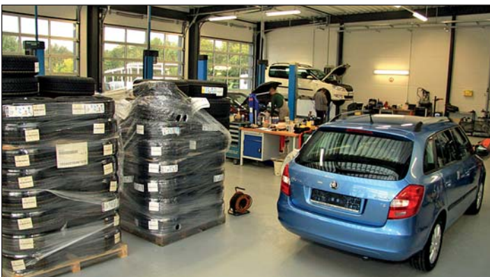
Blick in die Werkstatt