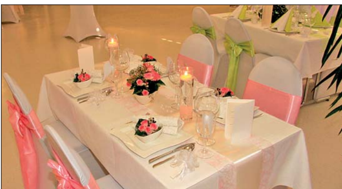
Hochzeitstafeln und Tischdeko - traumhaft schöne Ideen, vorgestellt vom Team des Bürgerhauses