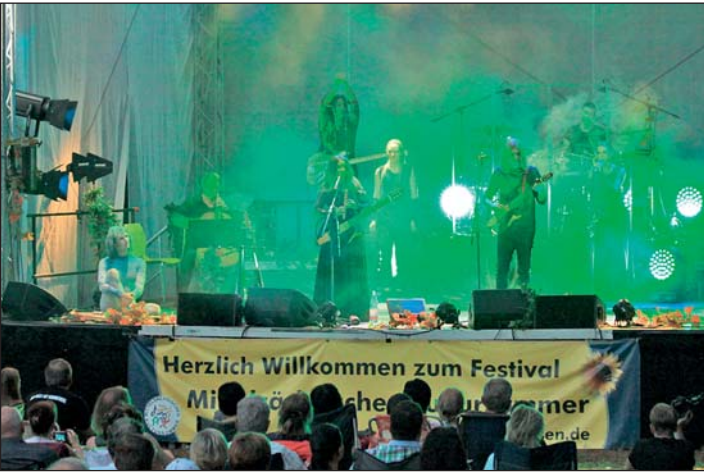
Rock, Celtic- und Folk-Rock - „Elftal The Rock Opera“