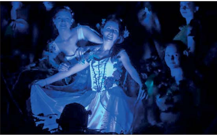
Balletteinlage zur Rockoper