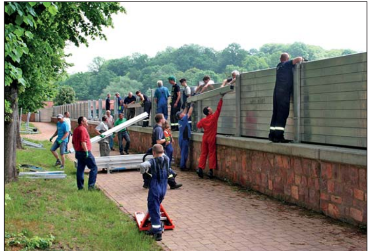
Aufbau der mobilen Hochwasserschutzwand an der Uferstraße