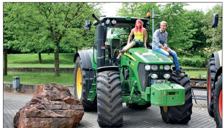
Mit dem PS- Monster auf Tuchführung