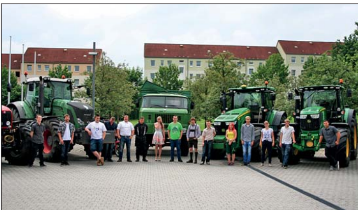
Ankunft der Absolventen vor dem BSZ Rochlitz