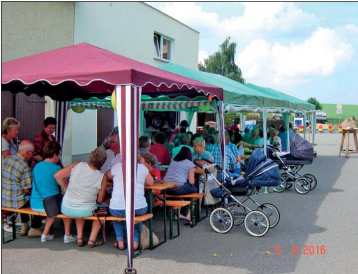
Beim Kaffeetrinken waren die Zelte bis auf den letzten Platz besetzt.