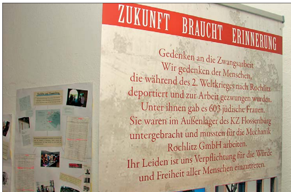
„Spurensuche“ - im Wächterladen werden Ausstellungen zu verschiedenen historischen Stadtthemen präsentiert.