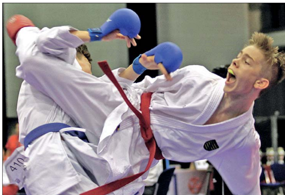
Valentin sichert sich mit einem 8:0 Sieg den Finaleinzug