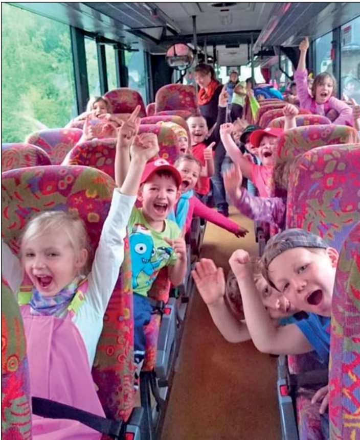
Schon die Busfahrt war für alle aufregend!

Zur Geisterstunde nahmen alle gespannt mit ihren Taschenlampen an der Nachtwanderung teil. Das Übernachten allein mit den Kindergartenfreunden und Erziehern als letzte Prüfung meisterten die Vorschüler bravourös.