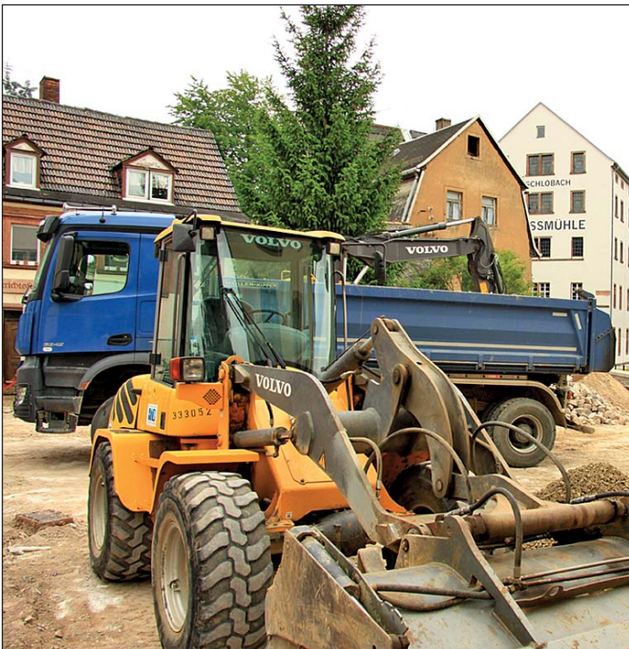
Die Sanierungsarbeiten am Mühlplatz haben begonnen. Ausführender Baubetrieb ist die Hoch- und Tiefbau Rochlitz GmbH (HTB).