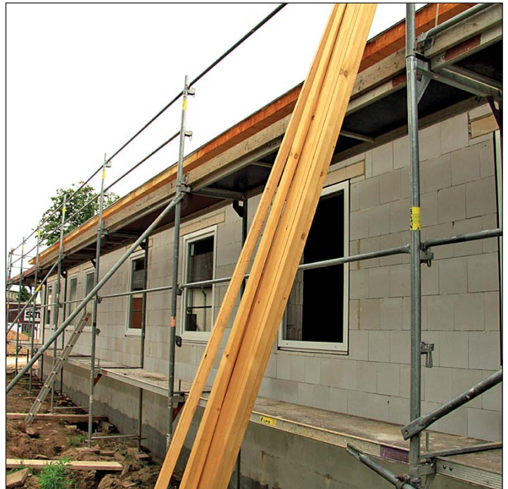
Anbau des neuen Domizils vom VfA Rochlitzer Berg an das BSC-Vereinsheim: Sockel, Bodenplatte und Mauerwerk sind fertiggestellt. Kürzlich wurde das Dachtragwerk mittels Kran montiert und anschließend abgedichtet.