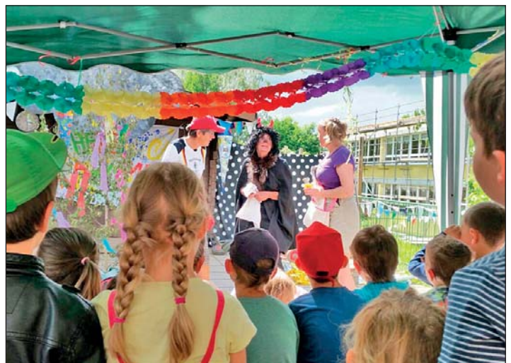
Die Aufregung war am Siedepunkt, als der Teufel die Zuckertüten stahl.

Die Zeit bis zur Ankunft der Kinder aus dem Feriendorf am Samstag, den 18.06.2016 nutzten die Erzieher und Eltern für die Vorbereitung des Zuckertütenfestes. Inszeniert durch die Erzieher umrahmte das Fest ein Theaterstück ringsum die langersehnten Zuckertüten für die Vorschüler.