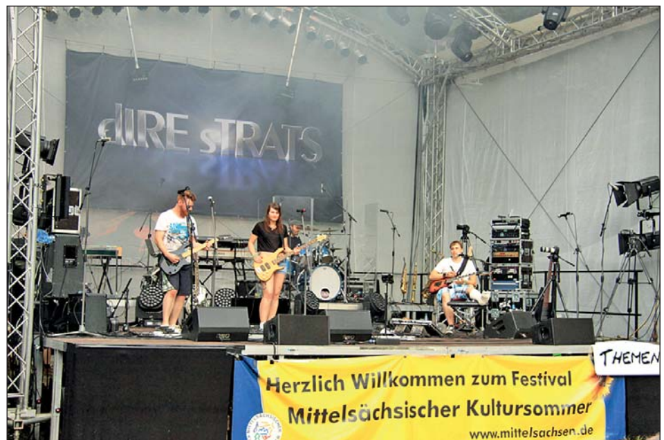
Schülerband Themenwexel spielte im Vorprogramm auf