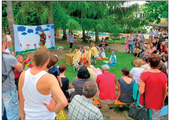
Der Auftritt der Gruppe: „Rudi Raben“