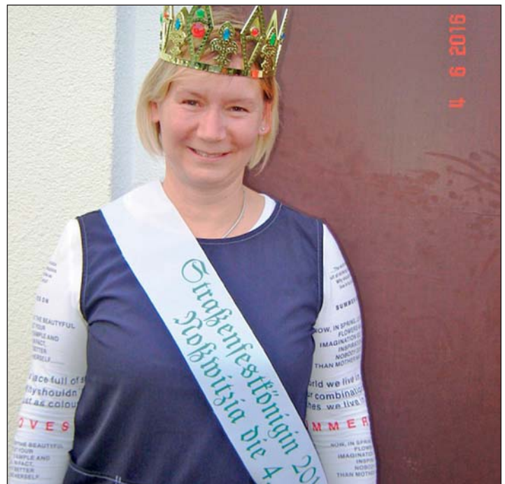
Die neue Straßenfestkönigin 2016

würste, Käsespieße, Gurken aus eigener Ernte und andere Leckereien zur Verfügung gestellt. Danach spielte ein Noßwitzer auf dem Akkordeon ein paar Lieder zum Mitsingen und Schunkeln.