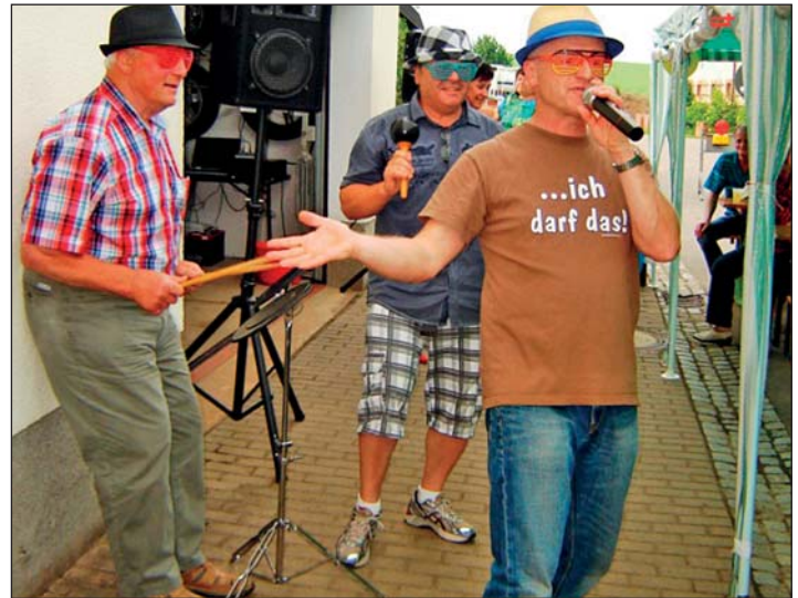
„Klausi“ mit Gästen aus dem Publikum beim Vortragen eines lustigen Liedes.

Für das Abendessen hatten die Noßwitzer Anwohner gesorgt und reichlich Salate jeder Art, eine Gulaschsuppe, Rostbratwürste, Bock-