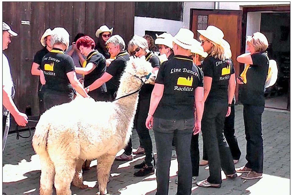
Auf Tuchfühlung mit den Alpakas

Gestärkt hieß es wieder auf der Pferdekutsche Platz nehmen und weiter ging es zur Heu - bodenherberge Zwicker in Linda. Bei einem „irren Duft von frischem Heu“ krochen wir in jeden Winkel und bedauerten, keine Zahnbürste und Wechselwäsche dabei zu haben. Also bestiegen wir wieder unsere „Karosse“ und trabten - am Teich entlang - zurück zum Lindenvorwerk. Dort war Freizeit