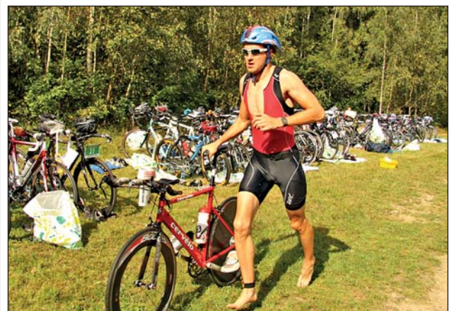
Triathlon kehrt nach 5-jähriger Pause nach Rochlitz zurück