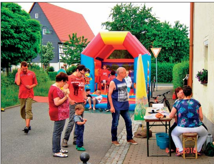
Hüpfburg und Kinderschminken (auch für Erwachsene).

Nach dem gemeinsamen Kaffeetrinken vergnügten sich die Kinder in der Hüpfburg, beim Kinderschminken, beim Torwandschießen, beim Ballspiel und anderen Spielen. Eine besondere Einlage für die Erwachsenen lieferte „Klausi“ aus Frankenberg mit seinen lustigen Erzählungen, Witzen, Sprüchen und Gesängen.