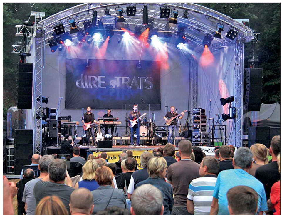
Liveact - DIRE sTRATS