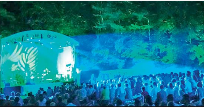
Licht und Laser - fantastische Illumination des Konzertgeländes