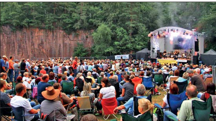
1600 Besucher waren Gäste des 2-tägigen Musikspektakels im Porphybruch