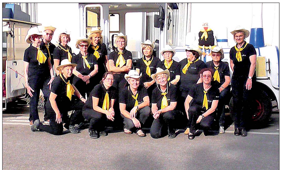
Die Rolidas vor dem Kohrener Landexpress