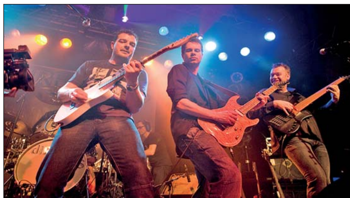
dIRE sTRATS