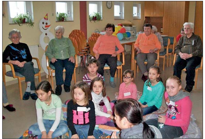
Winterquiz: Projekt des DRK-Hortes im Rahmen des Dreiecks der Generationen