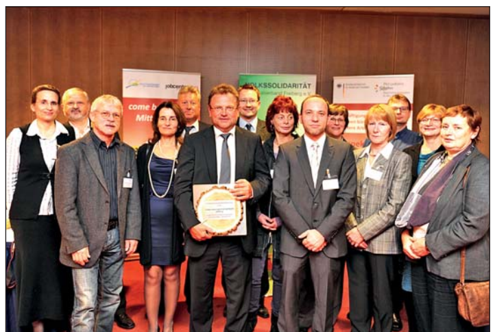
Auszeichnungen der SSG: 2. Platz beim 1. Sächsischen Generationenpreis 2011, 2. Platz beim 1. Sächsischen Altershilfepreis mit dem Pflegenetz 2013, Attraktiver Arbeitgeber Pflege 2014, Focus "Top Pflegeheim Deutschlands" 2015