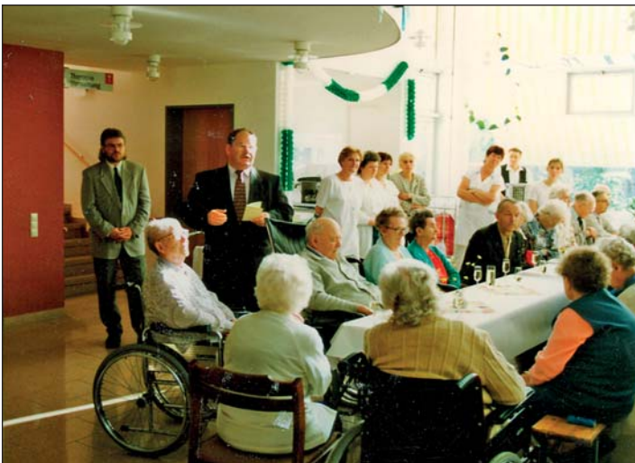
1996 - Eröffnung Alten-Pflege-Heim