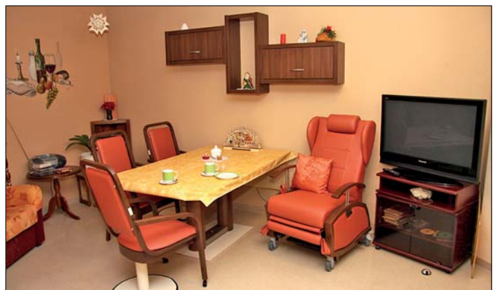
Neu möblierter Gemeinschaftsraum im 2. Obergeschoss