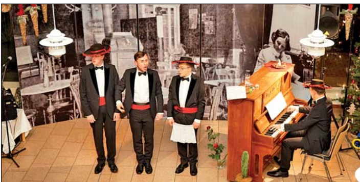
Kulturcafe - Unterhaltung pur für Heimbewohner, Angehörige und Gäste