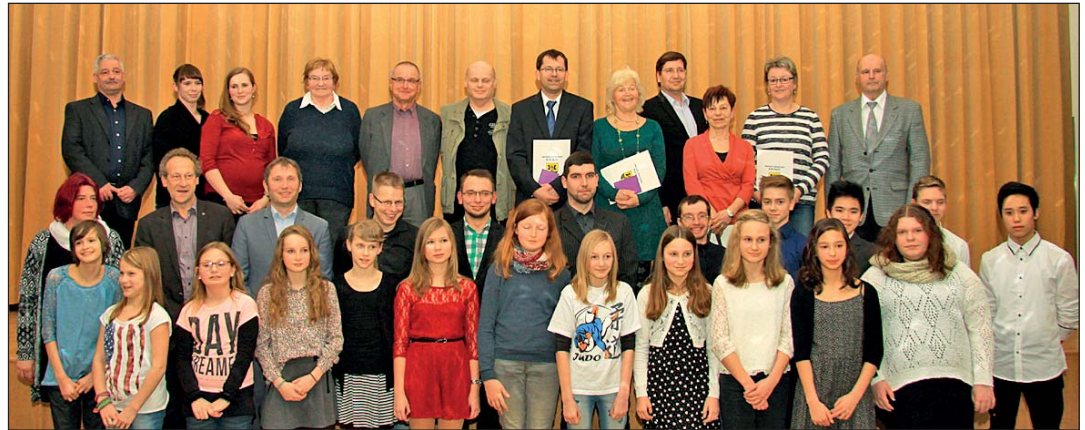
Gruppenbild aller geehrten Veranstaltungsteilnehmer

Zu einer Festveranstaltung im Bürgerhaus hatte kürzlich Oberbürgermeister Frank Dehne 43 Sportler und engagierte Bürger im Ehrenamt eingeladen. Für besondere Leistungen auf sozialem, kulturellem und sportlichem Gebiet wurden die Auserwählten mit Urkunden, Medaillen und Sachpreisen ausgezeichnet.