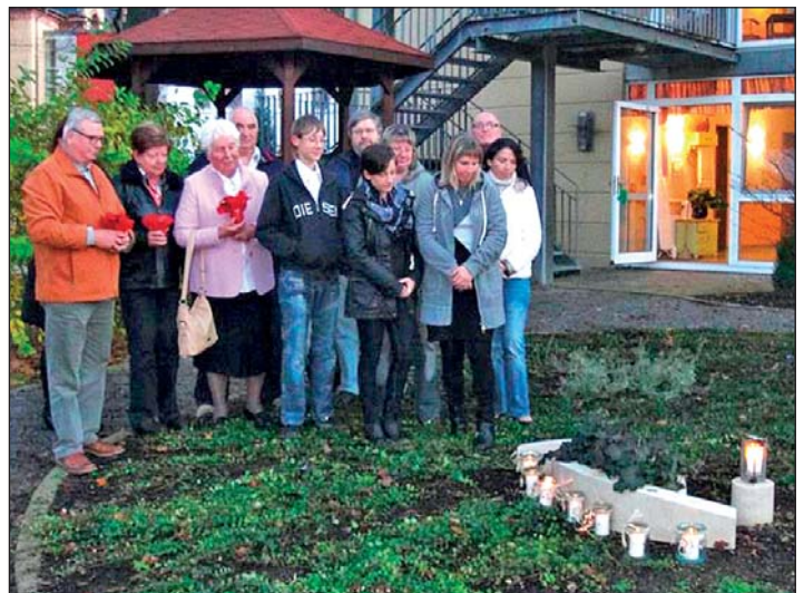
Erinnerungsdenkmal im Sinnesgarten - diese kleine Oase mit integrierten Sitzgelegenheiten lädt zum Erleben der Natur ein und dient als Begegnungsstätte für Bewohner, Angehörige und Mitarbeiter.