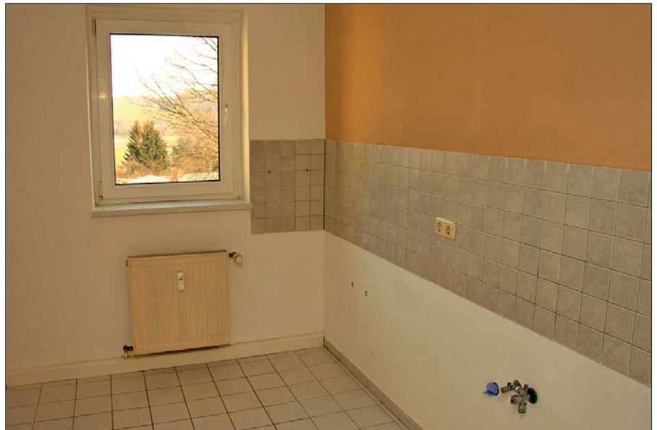
Blick in die Küche der 2-Raumwohnung. Die malermäßige Instandsetzung wurde vom Vermieter vorgenommen.