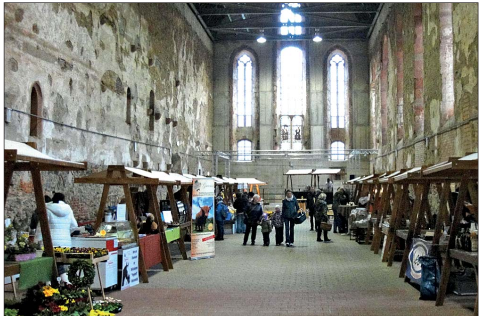
Frischemarkt in der Klosterkirche Grimma