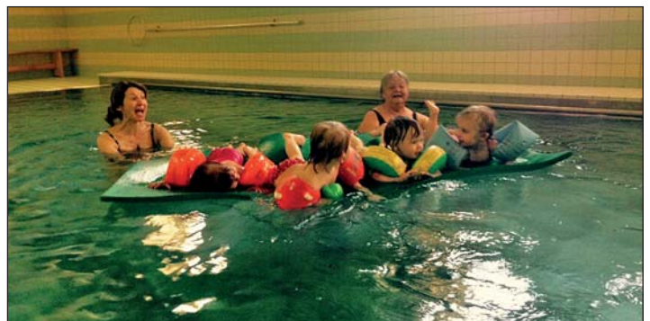
Angebot der Kindertagespflege der SSG - Babyschwimmen in der Oberschule „An der Mulde“