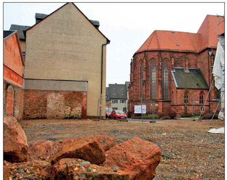
Rückbau Schulgasse 23/25

folgende Restarbeiten stehen noch an: Giebelsanierung, Instandsetzung der Stadtmauer und Herrichten des Grundstücks