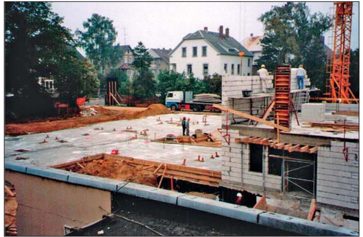
Rohbau nimmt Konturen an