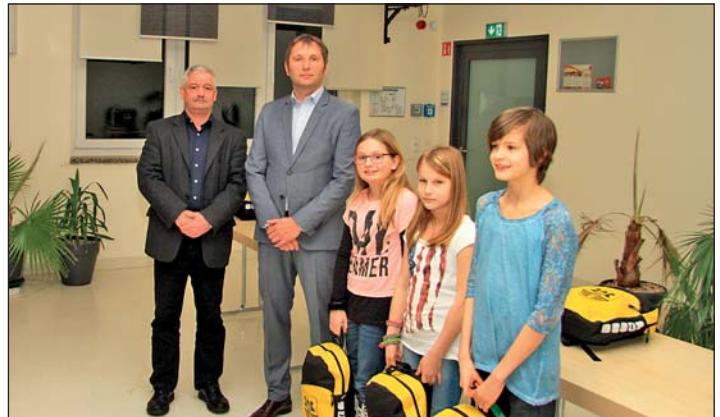
Mädchenmannschaft U10 vom BSC Motor Rochlitz Abteilung Faustball