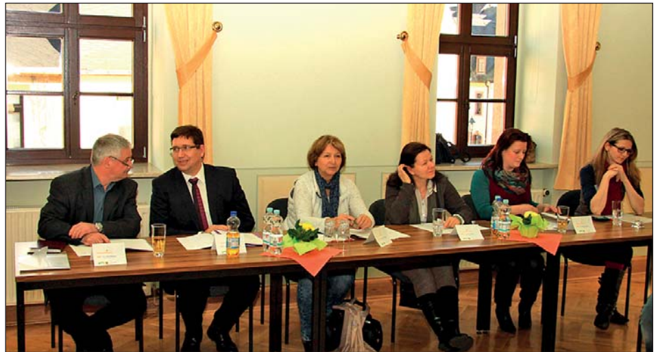
Aufmerksam verfolgt und bewertet die Jury die dargebotenen Leseleistungen.