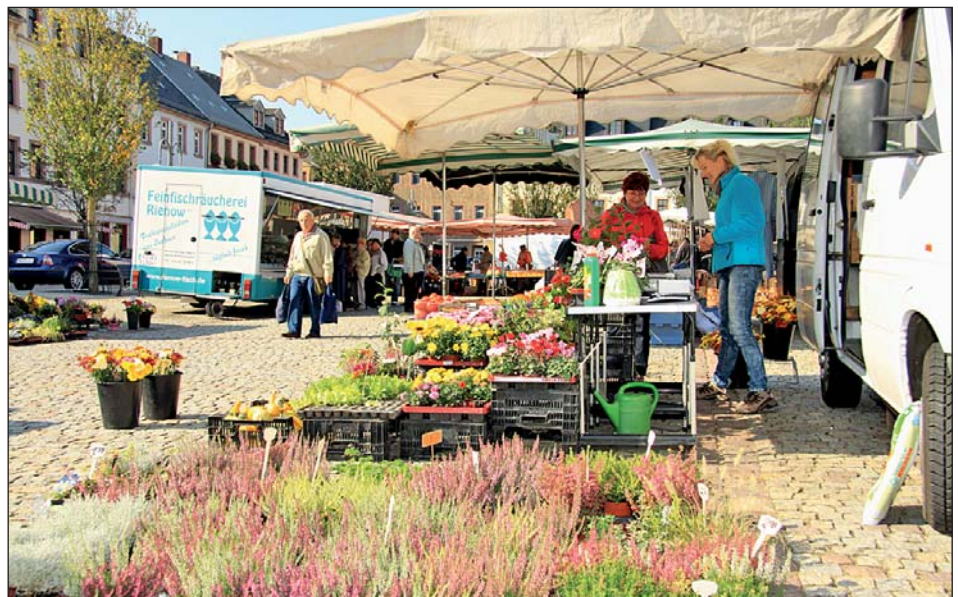
Rochlitzer Wochenmarkt