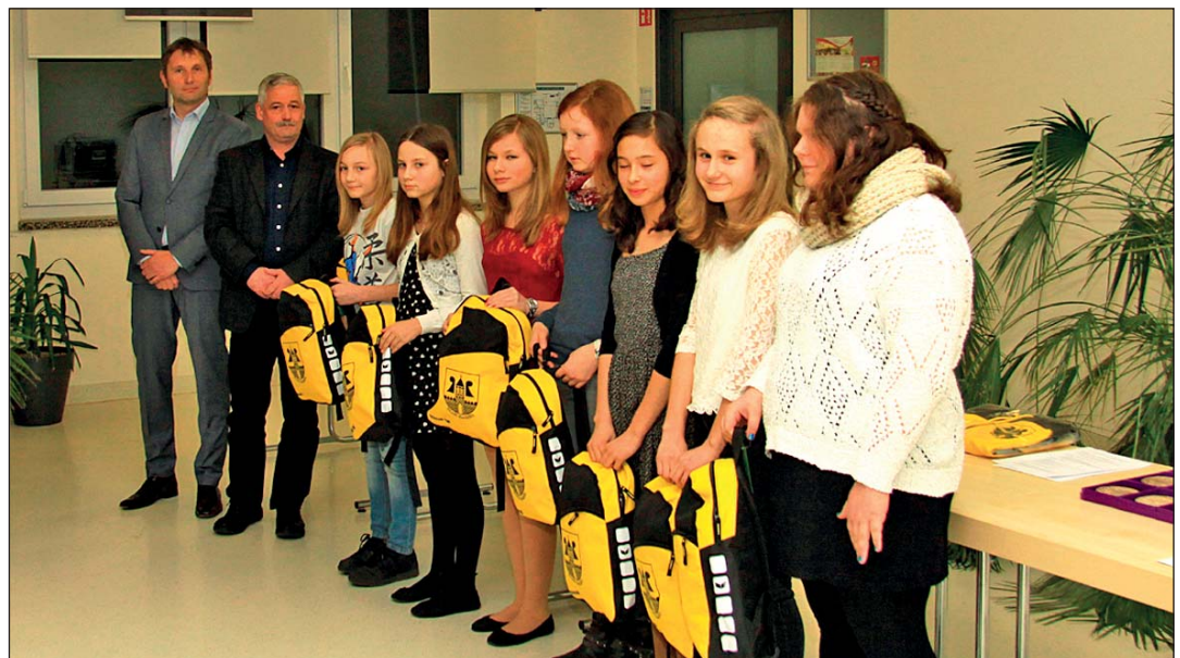
Mädchenmannschaft U13 Abteilung Judo

„Wenn wir heute 43 junge Menschen und verdiente Bürger auszeichnen, ist dies ein eindrucksvoller Gradmesser für ein intaktes, ausgeprägtes Gemeinschaftsleben in unserer Stadt.“