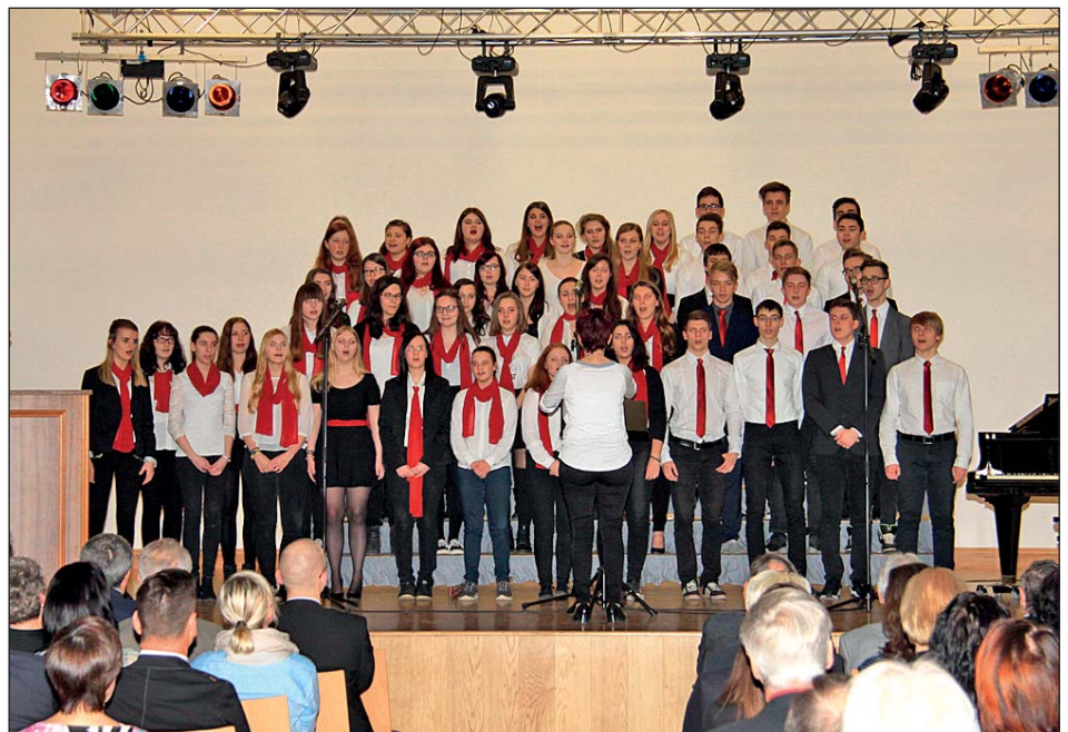
Der Chor des Johann-Mathesius-Gymnasiums gestaltete das kulturelle Rahmenprogramm