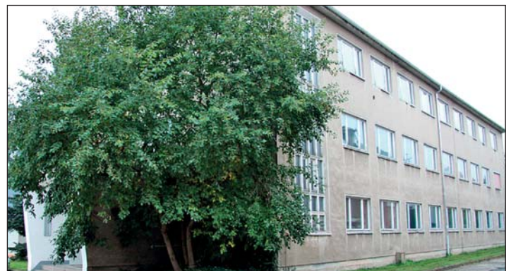
Das ehemalige CBZ-Gebäude in der Schützenstraße hatte die Stadt noch im Herbst als eine mögliche Unterkunft zur Unterbringung von Flüchtlingen in Erwägung gezogen.

„Wir haben diesen offensiven Weg gewählt, weil wir uns der Verantwortung zur Unterbringung von Asylbewerbern stellen müssen und bezüglich der Anforderungen an eine solche Unterkunft keine Abstri-