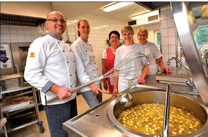
2015 erhält das Küchen-Team der SSG die Zertifizierung „My Kessel“