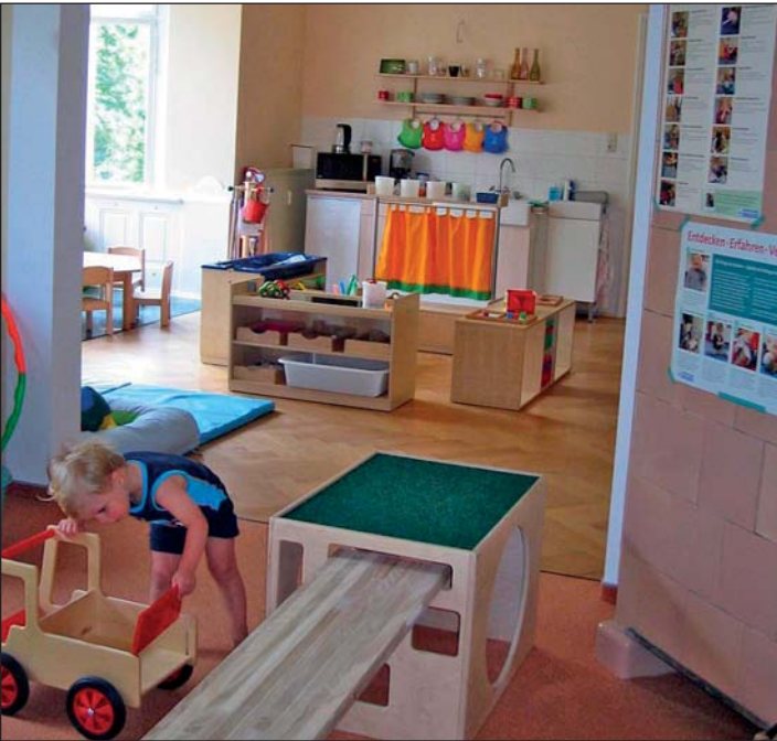
Zu den Highlights 2013 gehörte die Neueröffnung der Kindertagespflege in der Bismarckstraße 25