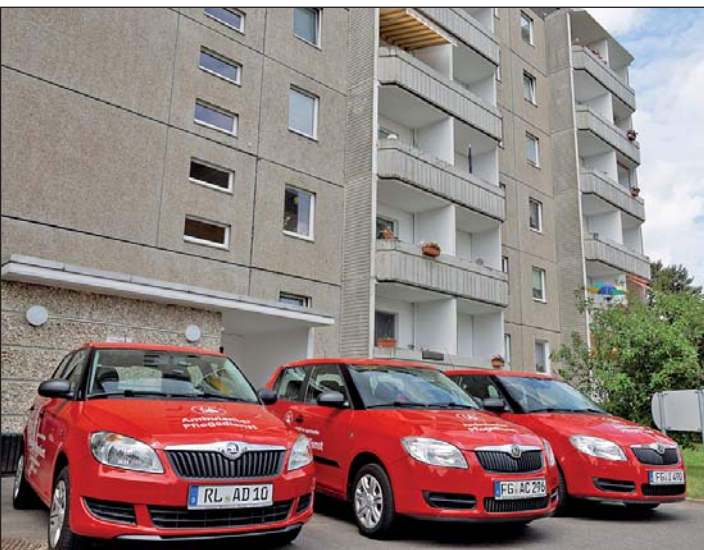
Fahrzeugflotte des Ambulanten Pflegedienstes am Wohn- und Servicezentrum Geithainer Straße