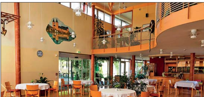
Blick in die einladend ausgestattete und dekorierte Cafeteria