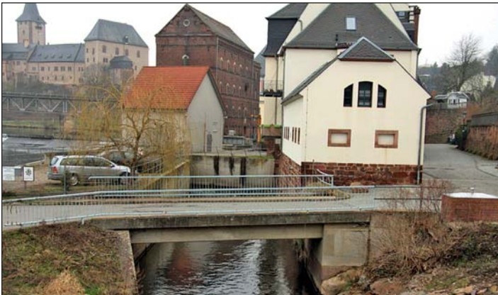
Im Frühjahr soll die Instandsetzung der Brücke über den Mühlgraben zur Muldeinsel erfolgen. Den Bauauftrag hat die Hoch- und Tiefbau GmbH Rochlitz erhalten.